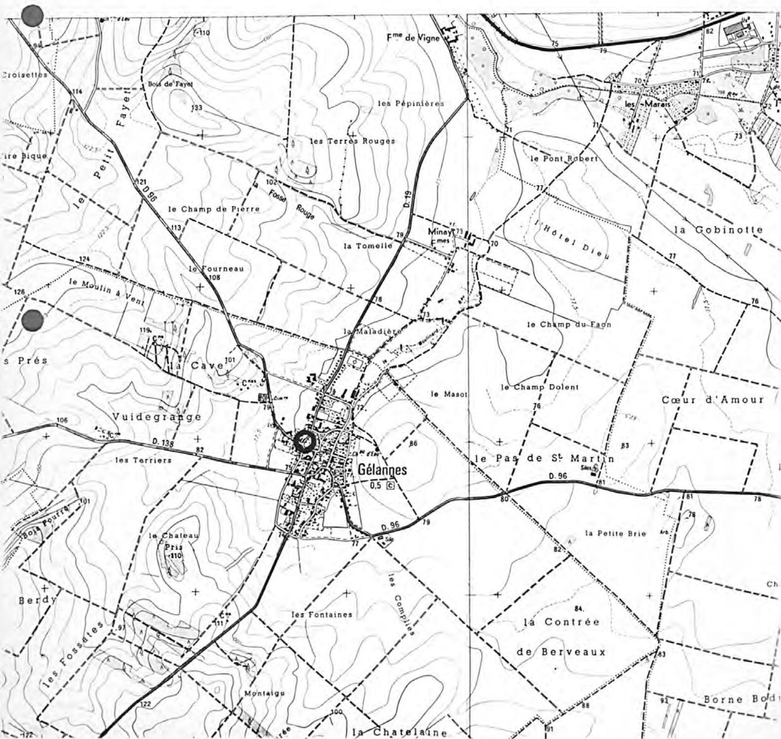
Pl. I : Carte de localisation de l'oeuvre Carte topographique, I.G.N., 1982, 1/25 000e Romilly-sur-Seine, 2716 ouest