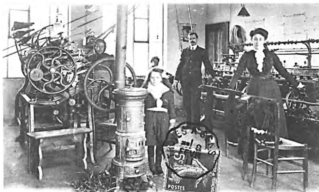
ESTISSAC (Aube). - Atelier de Bonneterie