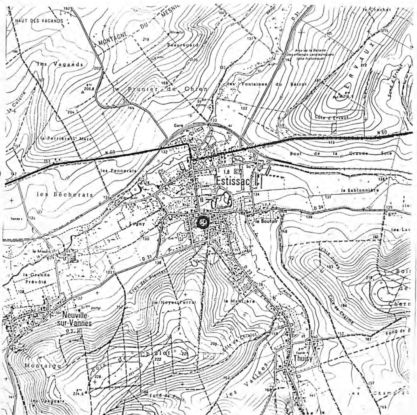
Pl. I : Carte de localisation de l'oeuvre Carte topographique, I.G.N., 1982, 1/25 000e Estissac, 2717 est