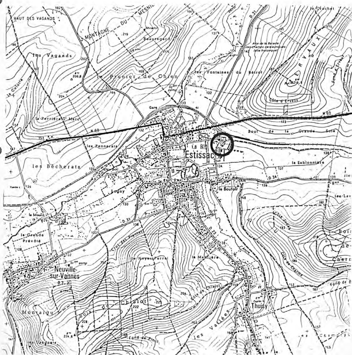
Pl. I : Carte de localisation de l'oeuvre Carte topographique, I.G.N., 1982, 1/25 000e Estissac, 2717 est