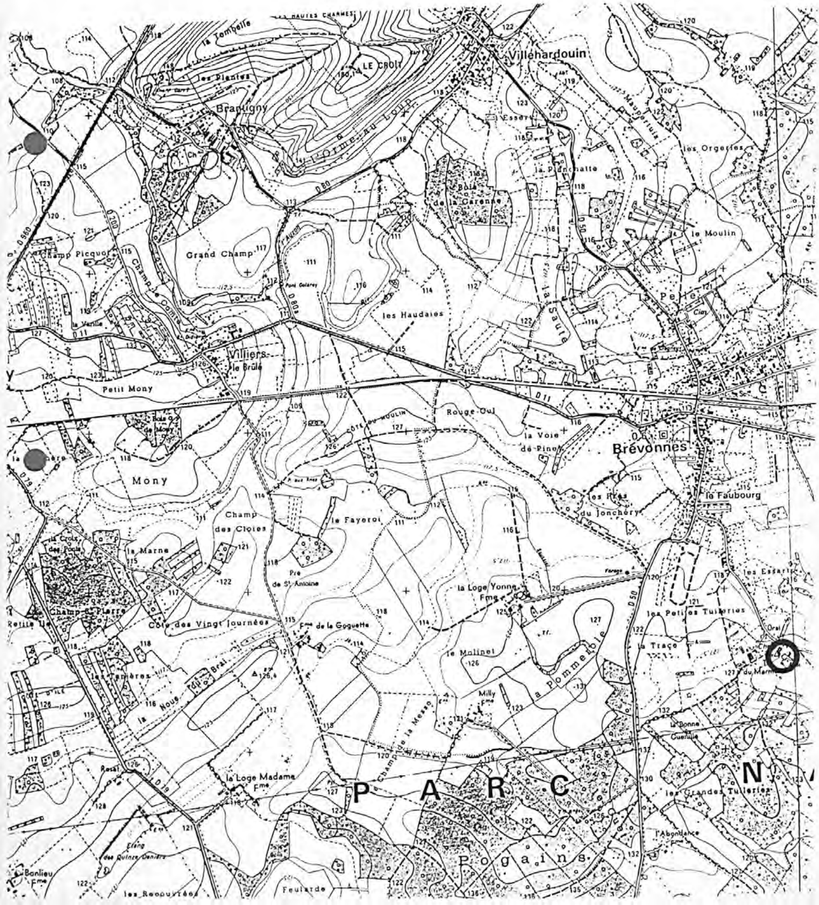
Pl. I : Carte de localisation de l'oeuvre Carte topographique, I.G.N., 1977, 1/25 000e Brienne-le-Château, 2917 ouest