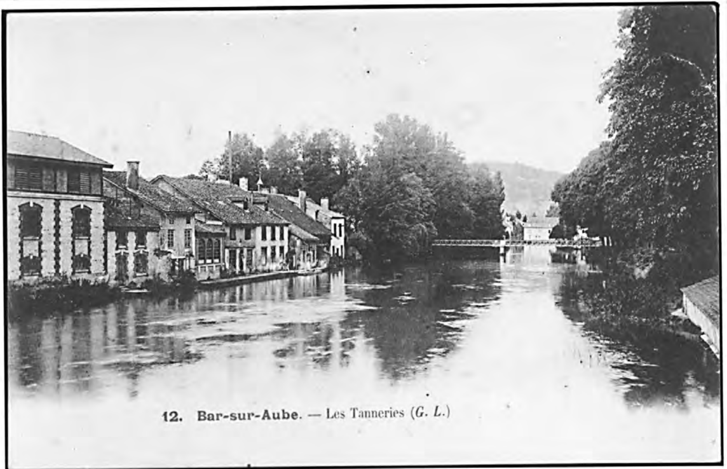
12. Bar-sur-Aube. — Les Tanneries (G. L.)