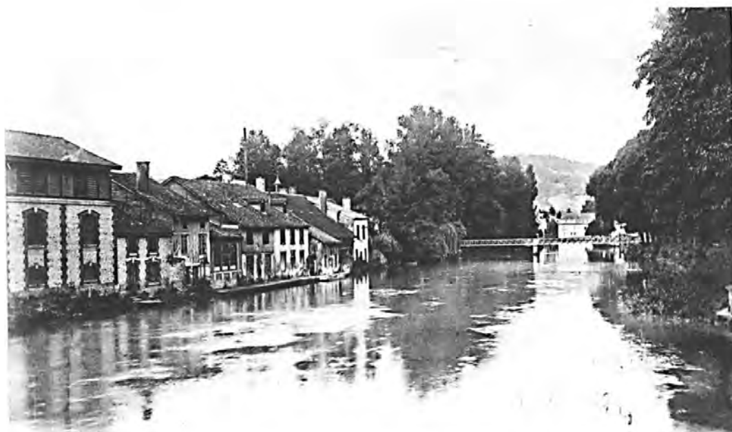
12 - BAR-SUR-AUBE - Les Anciennes Tanneries (G. L.)