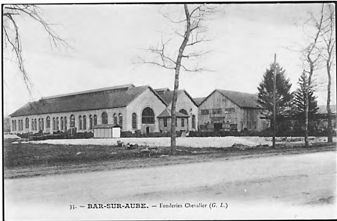
35. — BAR-SUR-AUBE. — Fonderies Chevalier (G. L.)