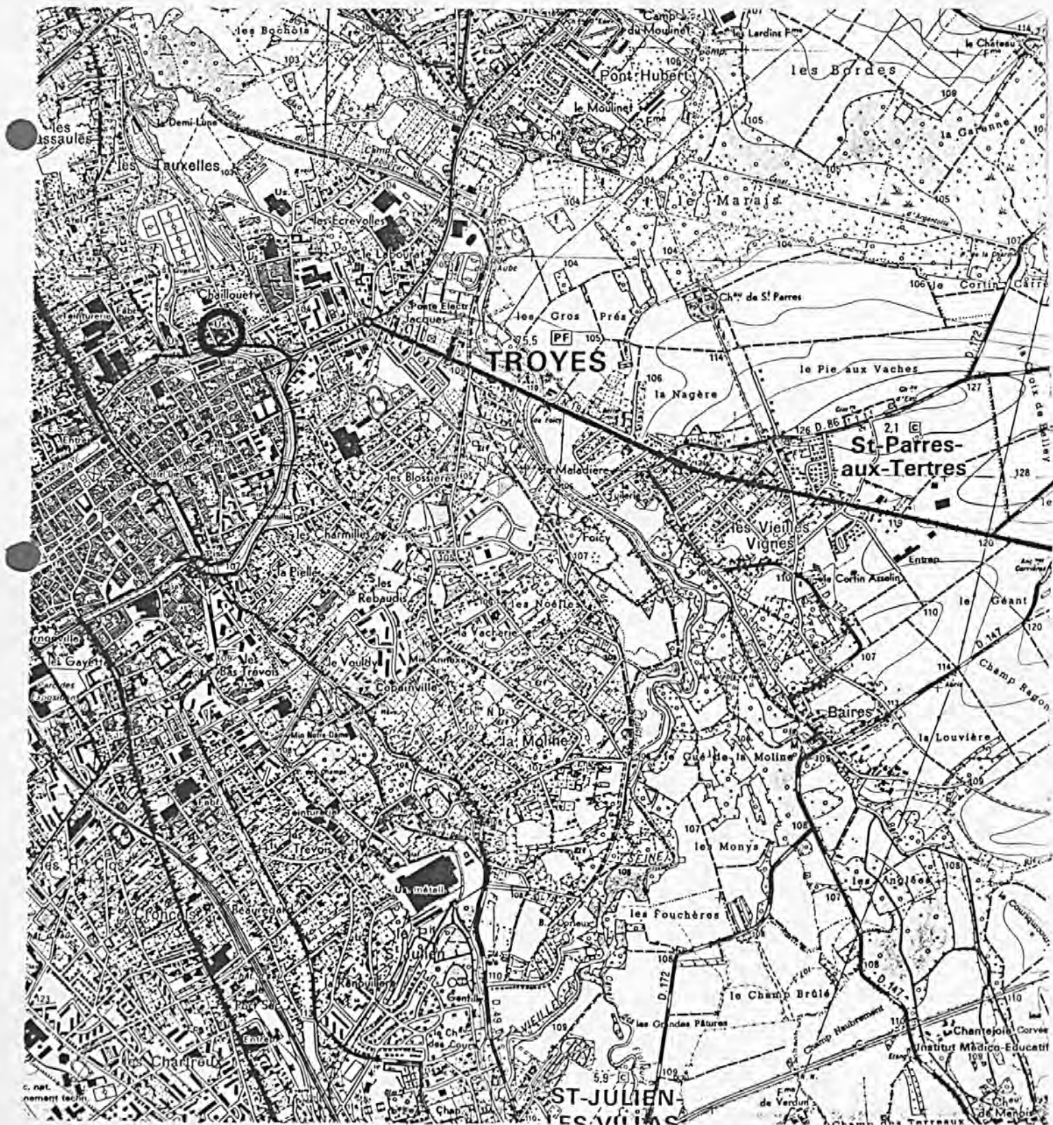
Pl. I : Carte de localisation de l'oeuvre Carte topographique, I.G.N., 1977, 1/25 000e Troyes, 2817 ouest