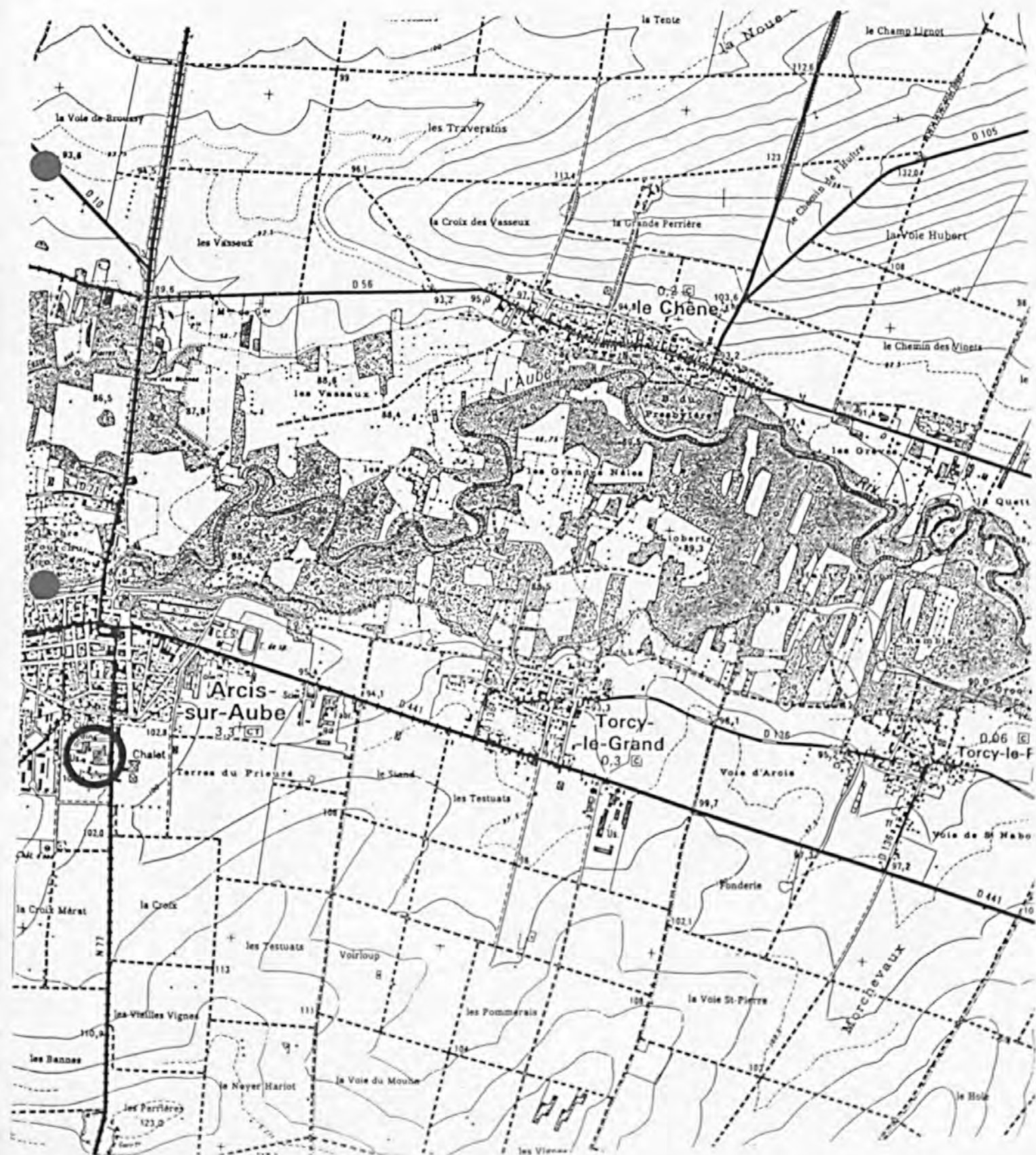
Pl. I : Carte de localisation de l'oeuvre Carte topographique, I.G.N., 1977, 1/25 000e Arcis-sur-Aube, 2816 est