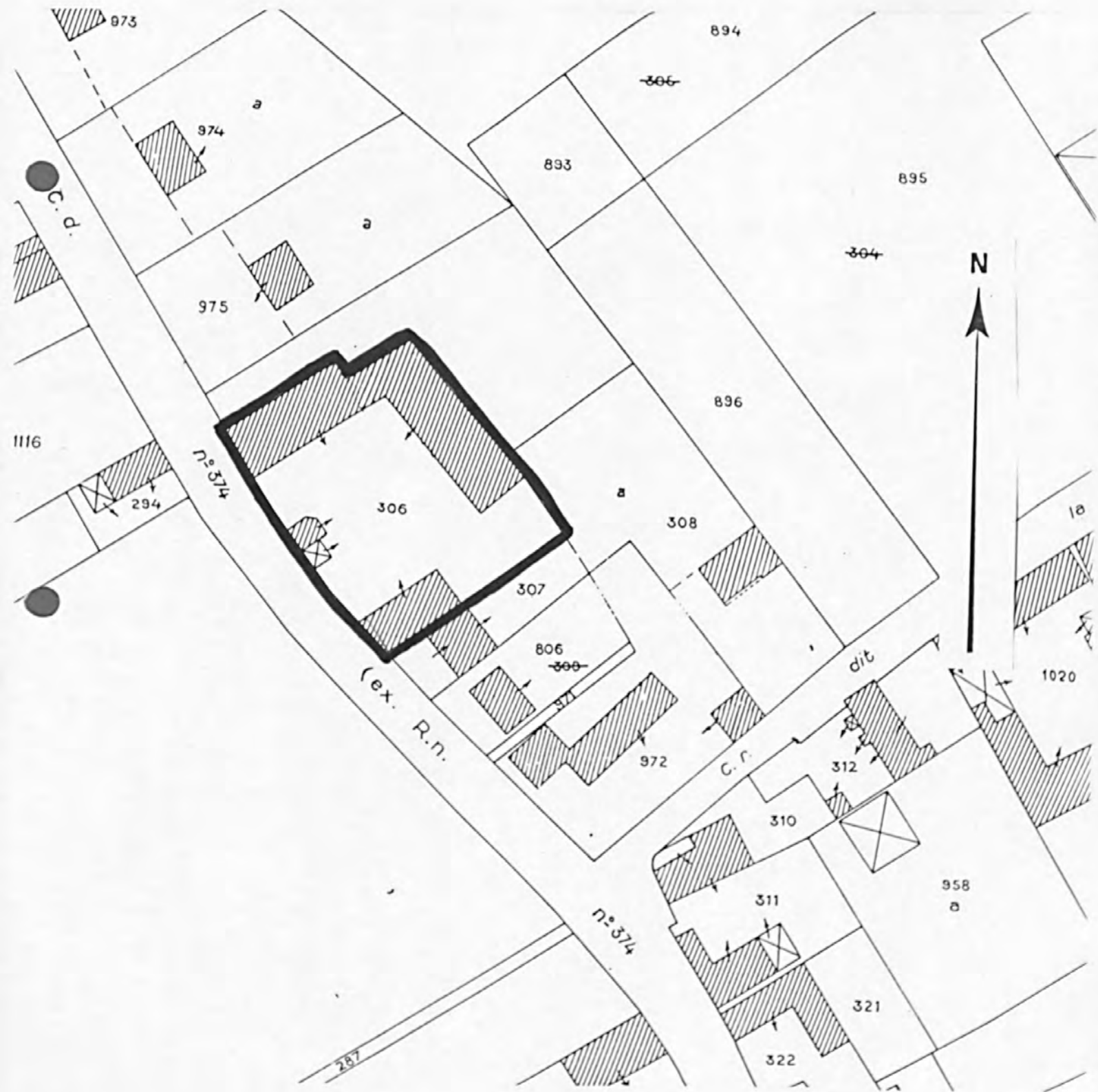
Pl. II : Plan de situation Extrait du cadastre, 1983 Section B, 1/1000e