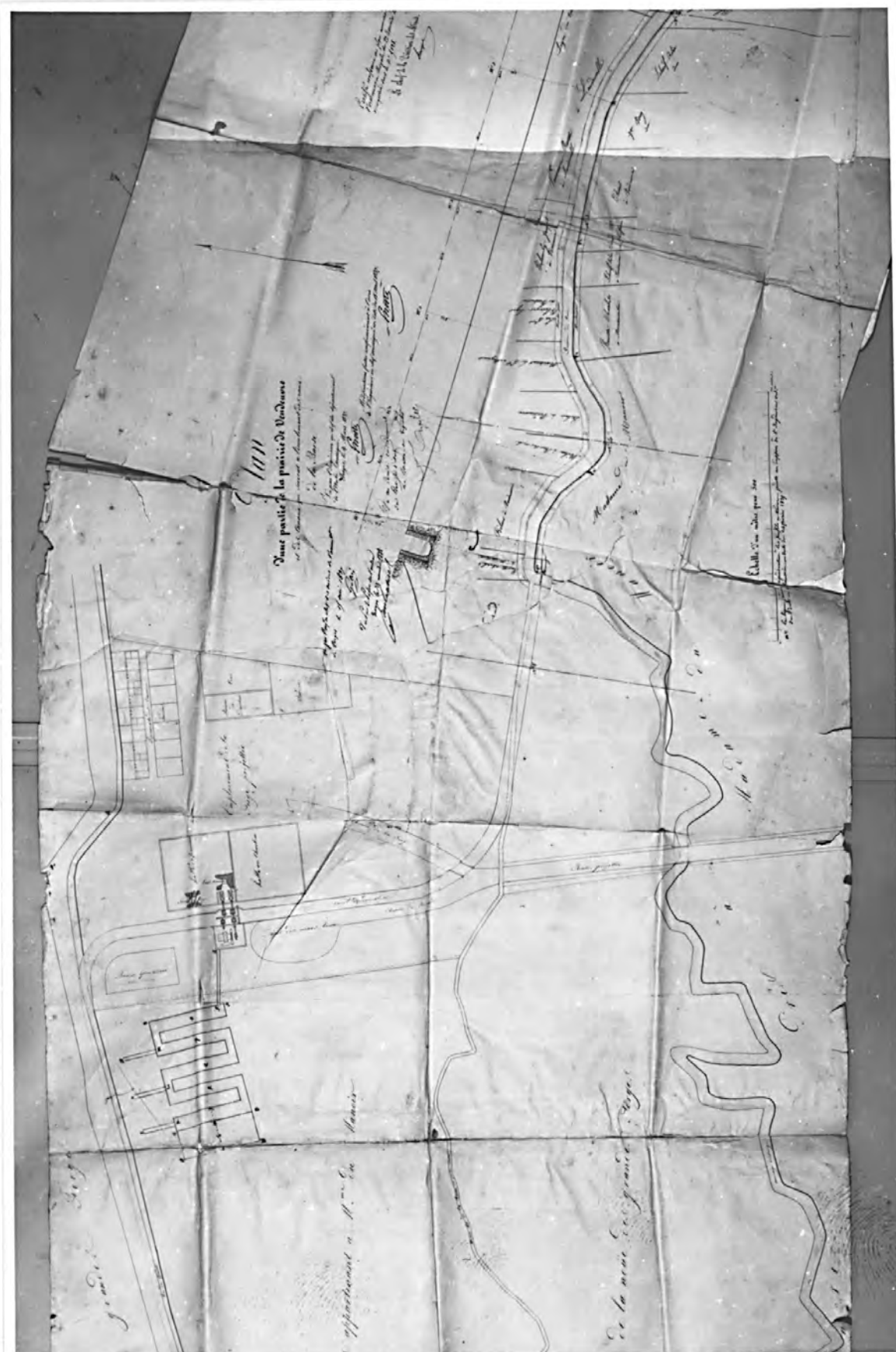
Doc. 1 : Plan d'ensemble, 1837 (A.N. F 14 4308)