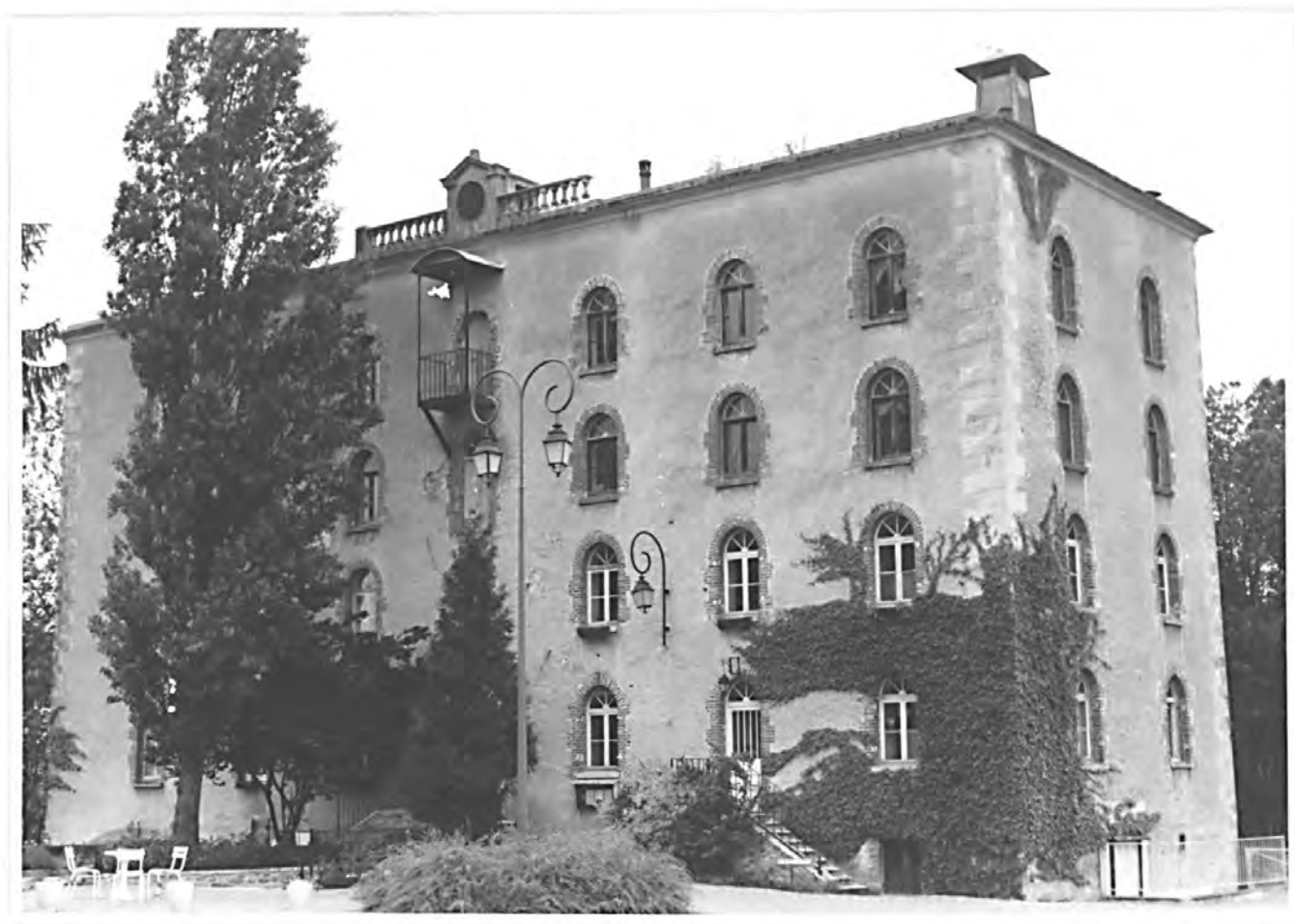
Fig. 3 : Minoterie vue depuis le sud-est