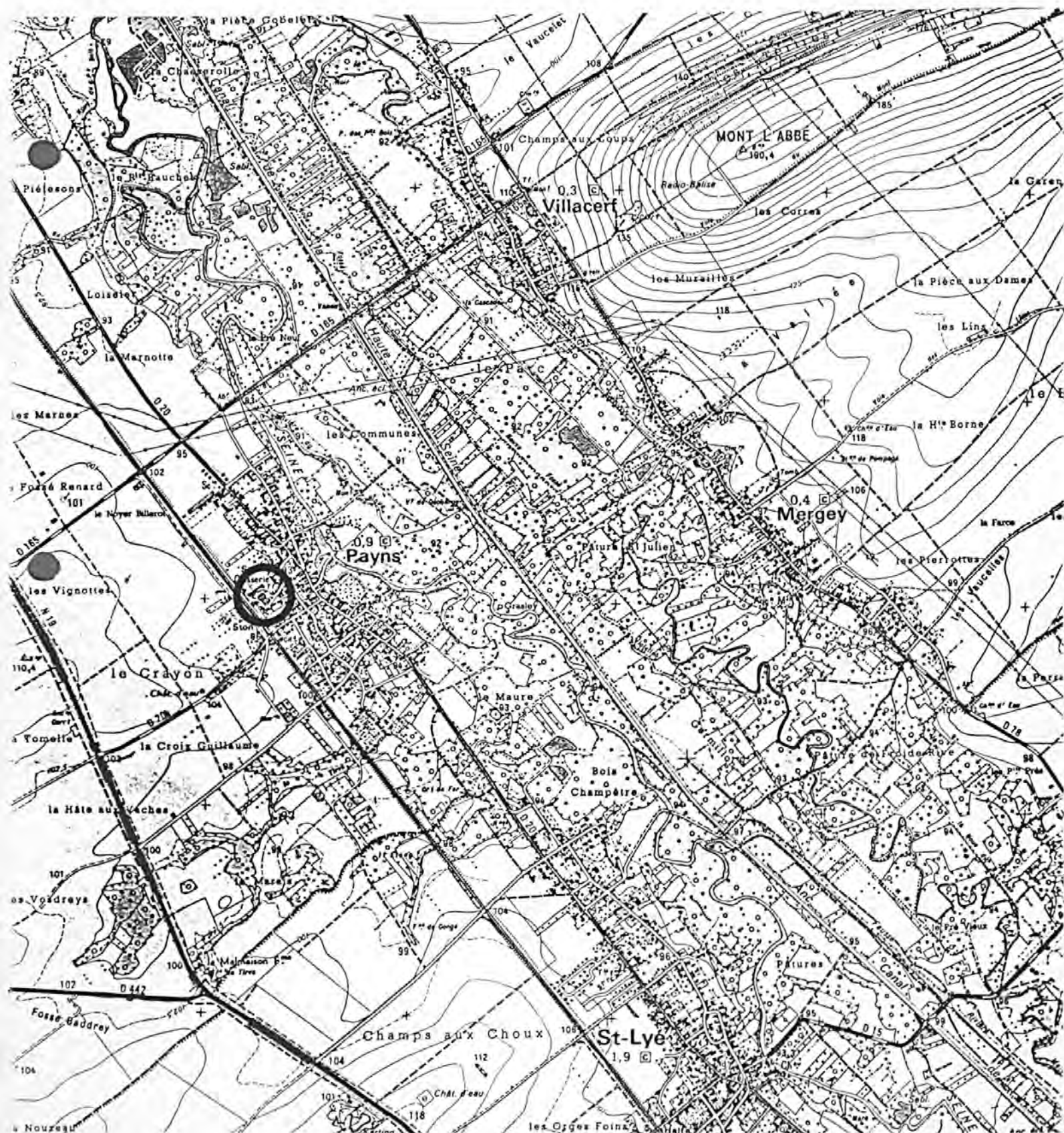
Pl. I : Carte de localisation de l'oeuvre Carte topographique, I.G.N., 1977, 1/25 000e Troyes, 2817 ouest