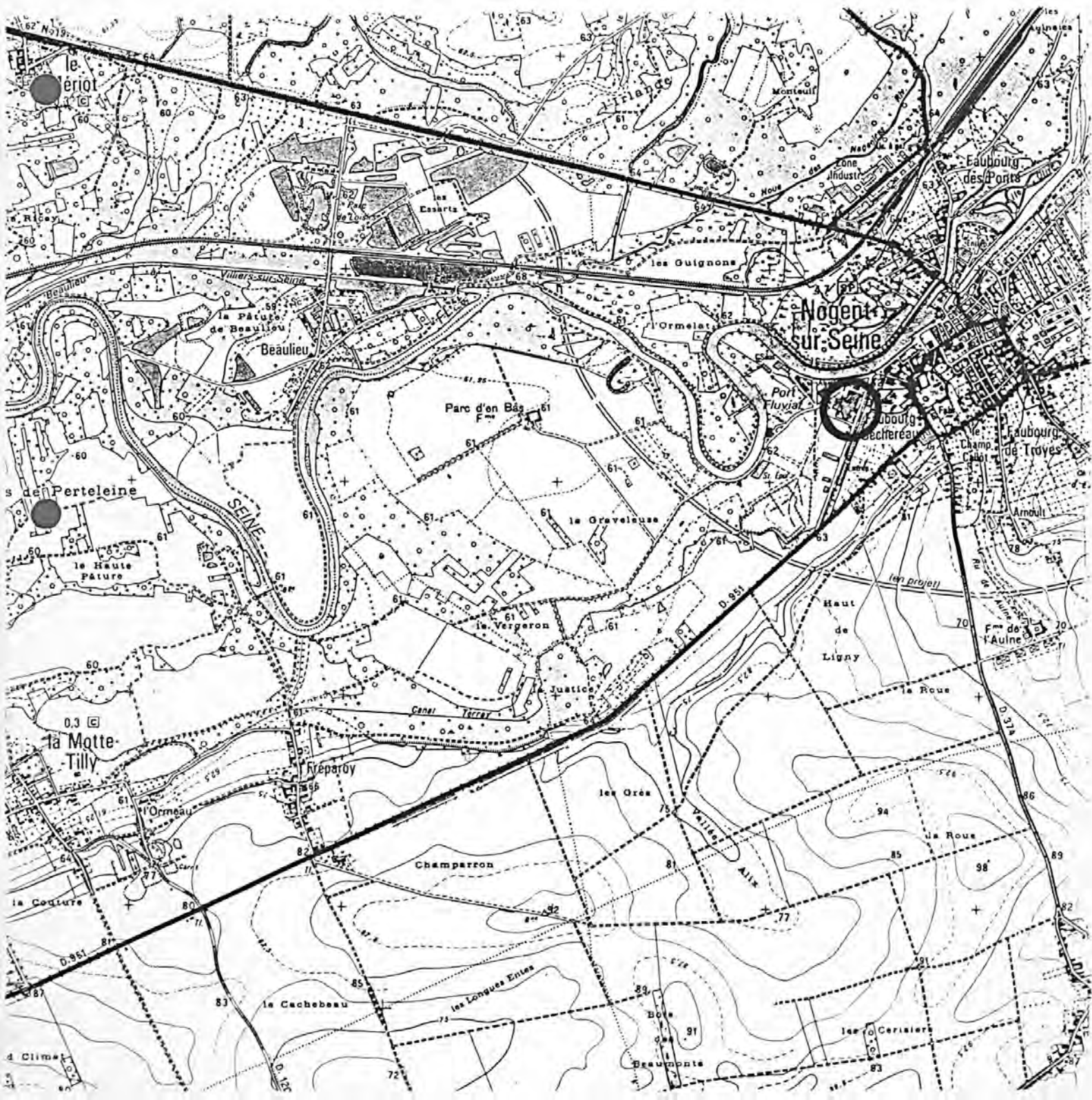
Pl. I : Carte de localisation de l'oeuvre Carte topographique, I.G.N., 1982, 1/25 000e Nogent-sur-Seine, 2616 est