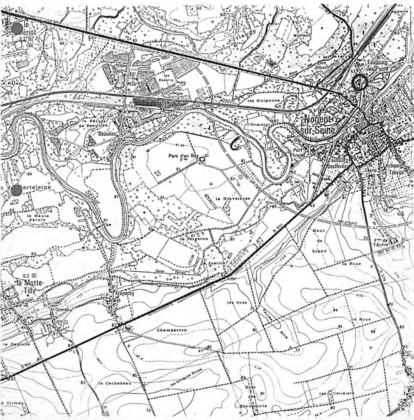
Pl. I : Carte de localisation de l'oeuvre Carte topographique, I.G.N., 1982, 1/25 000e Nogent-sur-Seine, 2616 est