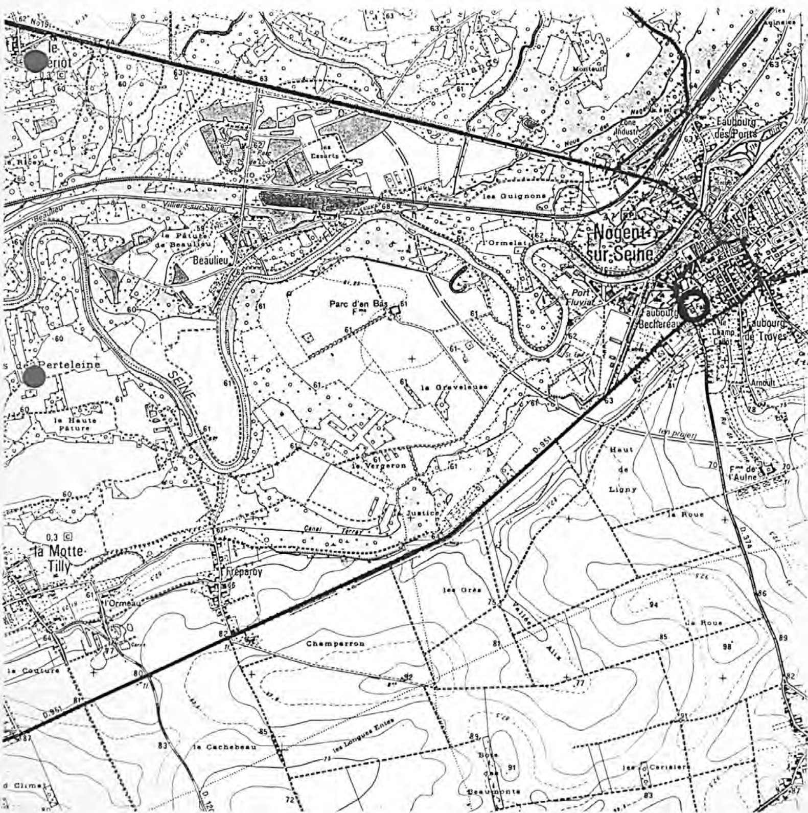
Pl. I : Carte de localisation de l'oeuvre Carte topographique, I.G.N., 1982, 1/25 000e Nogent-sur-Seine, 2616 est