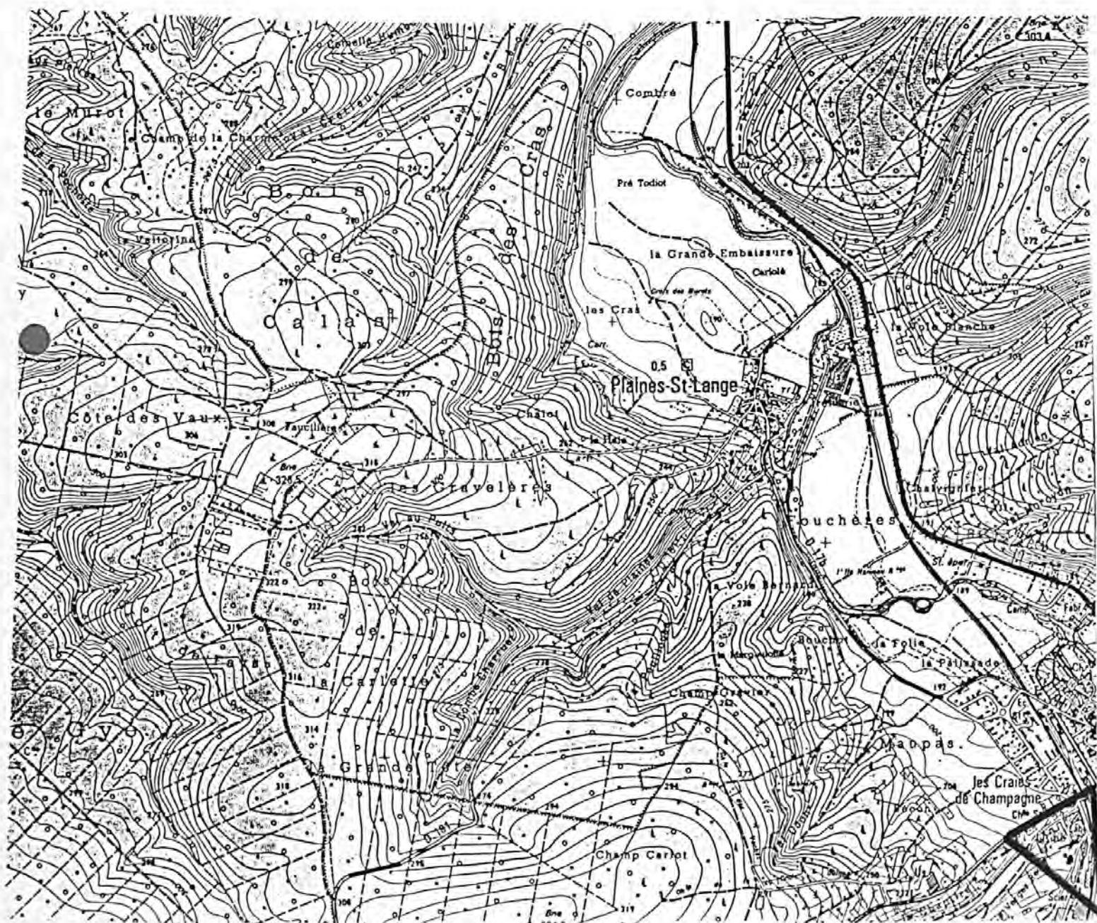
Pl. I : Carte de localisation de l'oeuvre Carte topographique, I.G.N., 1980, 1/25 000e Les Riceys, 2919 ouest