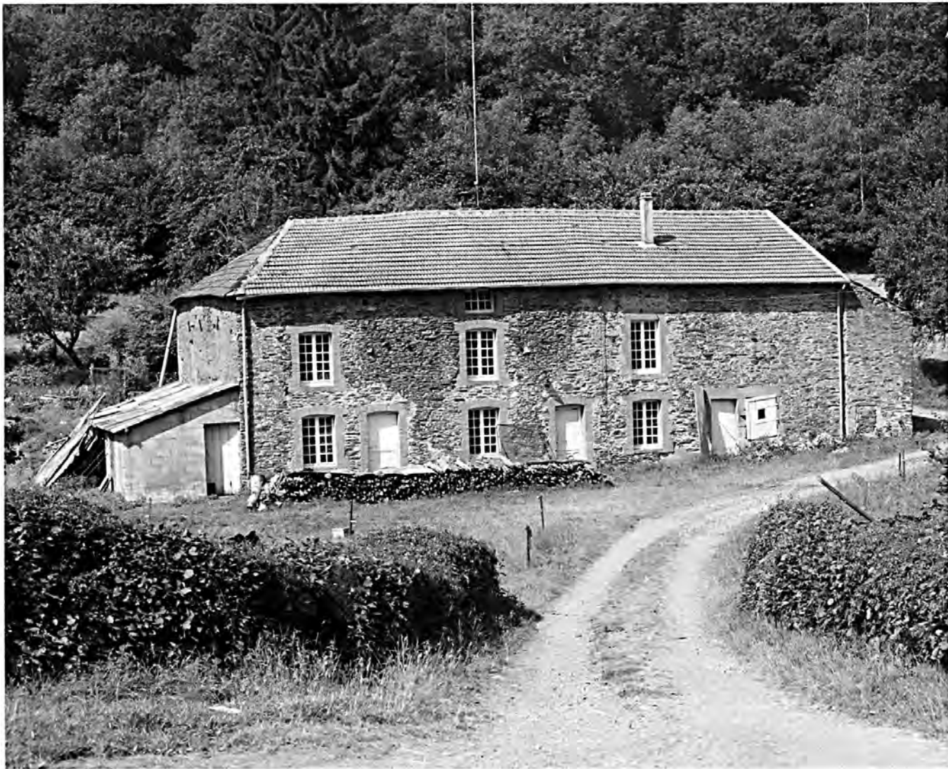
Fig. 1 : Elévation antérieure : la roue était à gauche (appentis).