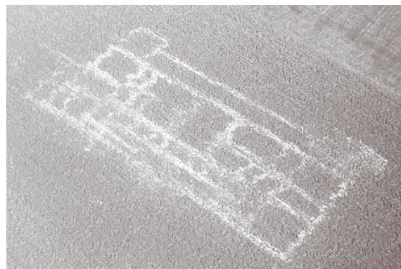
Photographie aérienne : villa gallo-romaine, Villers-sous-Ailly (Somme).

Les fouilles programmées sont motivées par des objectifs de recherche scientifique indépendants de toute menace pesant sur un gisement archéologique. Elles peuvent bénéficier d'aides financières du ministère chargé de la culture. Elles sont réalisées soit par ses agents, soit par des archéologues relevant d'autres institutions (universités, CNRS, collectivités territoriales...) ou indépendants. Aux fouilles de ce type s'ajoutent, dans le même cadre de recherche fondamentale, les prospections thématiques, les relevés d'art rupestre, ainsi que les projets collectifs de recherche.