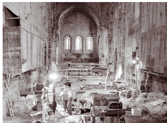
Notre-Dame-du-Bourg, Digne (Alpes-de-Haute-Provence).