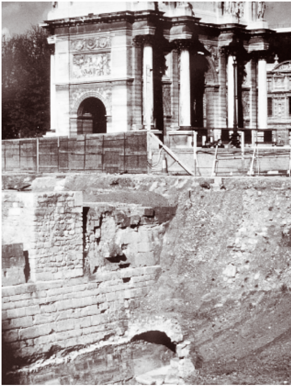
Carrousel du Louvre (Paris).