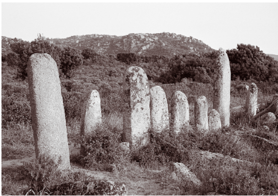
Alignement de Palaggiu, Sartène (Corse-du-Sud).