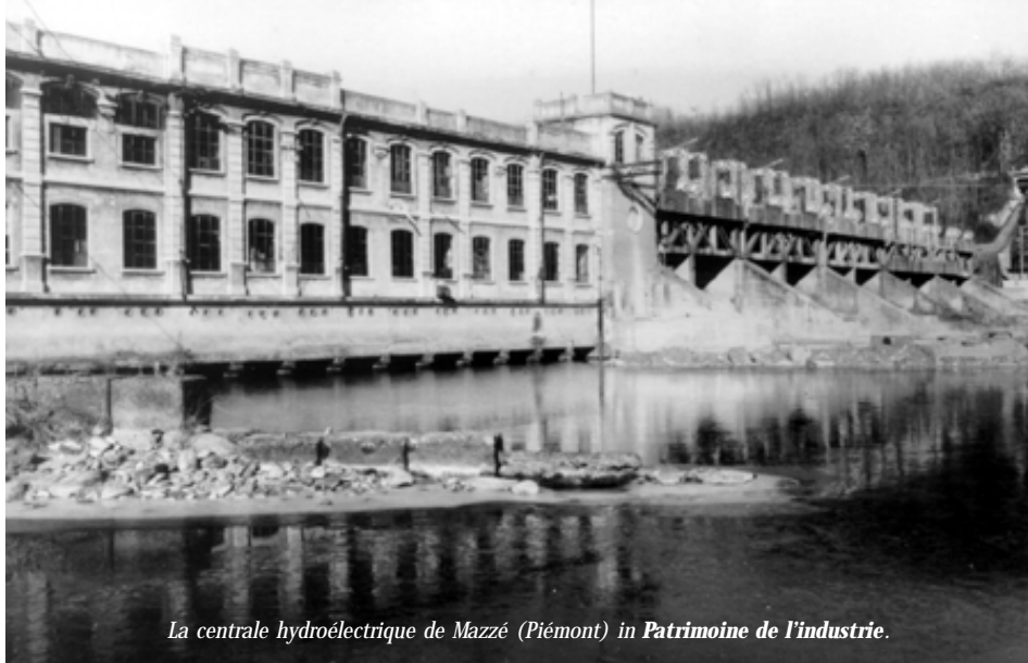
La centrale hydroélectrique de Mazzè (Piémont) in Patrimoine de l'industrie.