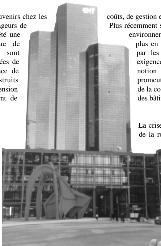
Paris La Défense.

En effet, l'exigence de flexibilité prend une acuité nouvelle : pour faire face aux variations du marché, l'entreprise veut pouvoir modifier continuellement son organisation et son espace. Les grands plateaux ouverts sont de retour, alors que se multiplient les activités bruyantes