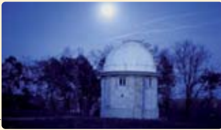
Observatoire de Bordeaux (commune de Floirac), abri de la lunette équatoriale de 8 pouces construit en 1882. Cl. M. Dubau, 2004

d'enseignement, les instruments didactiques et ceux liés à l'expérience, les pratiques et les « rituels » des communautés scientifiques, les archives de la science, des administrations scientifiques et des scientifiques eux-mêmes, autant de thèmes abordés dans les différents articles. Ce numéro présente aussi des actualités dans une rubrique Varia .