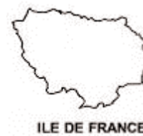
ILE DE FRANCE