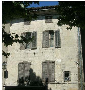
Mur en pierre de taille

Les produits hydrofuges et peintures sont à proscrire.