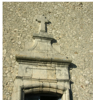
Mur de remplissage en moellons et décor en pierre de taille