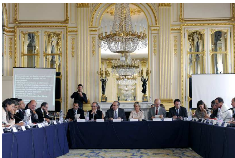
Conférence de Frédéric MITTERRAND, ministre de la Culture et de la Communication, et Nadine MORANO, secrétaire d'État chargée de la Famille et de la Solidarité