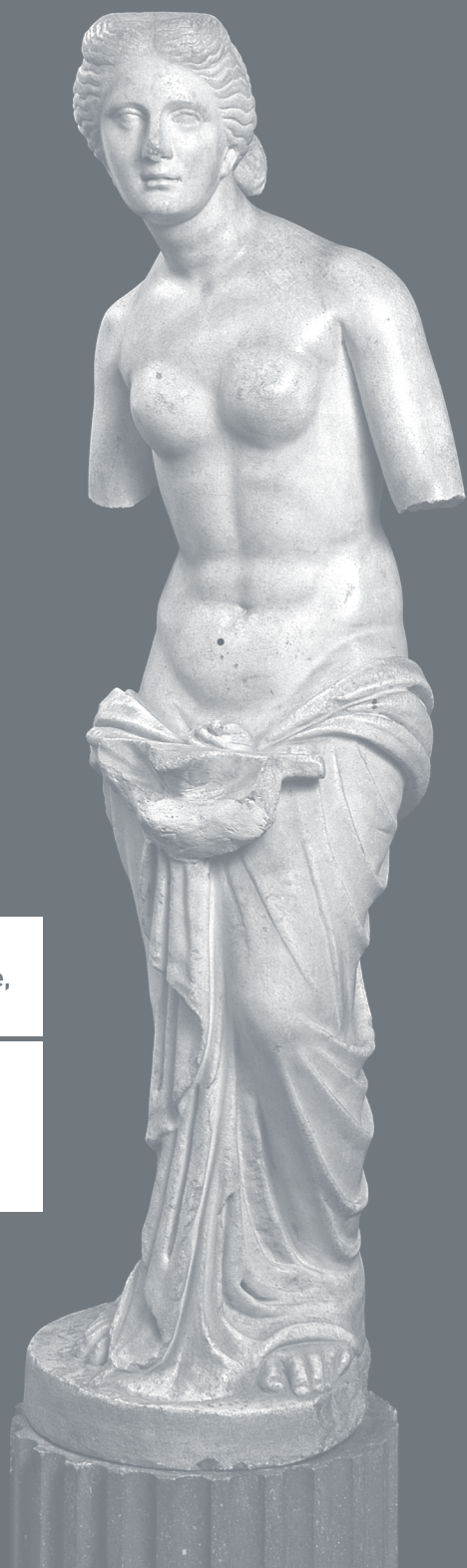
Aphrodite à la coquille dite Nymphe de Sainte-Colombe, marbre, IIe-IIIe siècle.

Œuvre d'intérêt patrimonial majeur acquise pour le musée gallo-romain de Saint-Romain-en-Gal (Vienne), grâce au mécénat de la Banque Neuflize OBC.