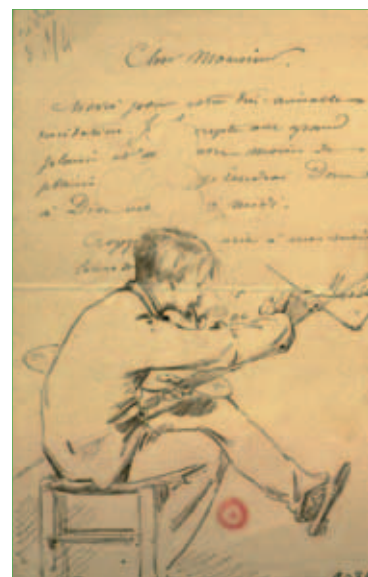
Photo : Lettre autographe du peintre Luc-Olivier Merson (1846-1920) mécénat de la société BIC pour le catalogage et la numérisation de lettres et d'autographes d'artistes conservés à la Bibliothèque de l'INHA - collections Jacques Doucet.