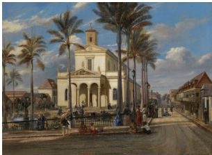
Vue de la cathédrale, Antoine-Louis ROUSSIN, 1877, huile sur toile

Exposition « La cathédrale de Saint-Denis et ses transformations ». Les 18 et 19 septembre