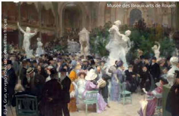
© J.-A. Grun, un vendredi au salon des artistes français