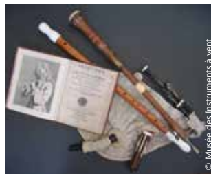
© Musée des Instruments à vent

Visite guidée sur l'histoire d'une ville. Balade dans les rues de La Couture-Boussey sur les traces de la facture instrumentale.