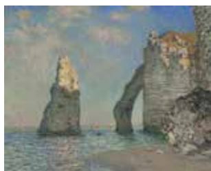
© Claude Monet - L'Aiguille et la falaise d'Avail. Williamstown, Sterling and Francine Clark Art Institute