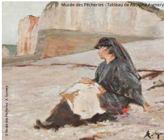
Musée des Pêcheries - Tableau de Adolphe Aumery

lehavre.fr/que-faire-au-havre/maison-de-larmateur