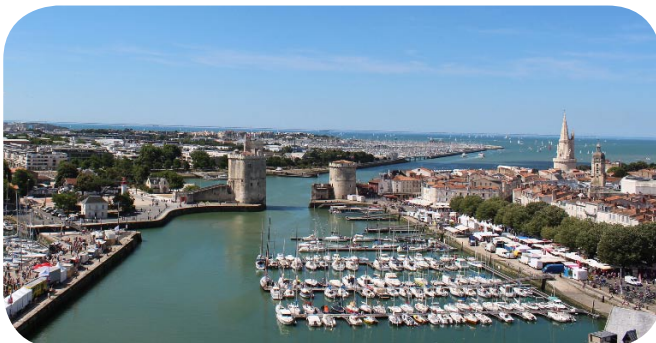
Vieux port ou havre d'échouage de La Rochelle