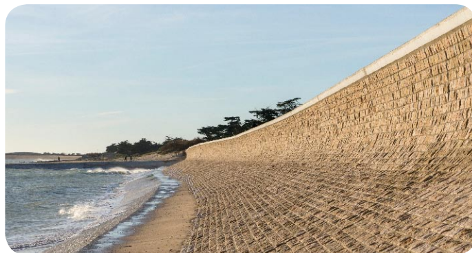
Digue du Boutillon

La Charente-Maritime présente un relief de plaines et de bas plateaux ainsi que des marais littoraux d'une grande richesse environnementale. Il se caractérise par des paysages allant de la côte, avec ses activités balnéaires et conchylicoles, aux vallons de Saintonge où domine la culture des vignes.