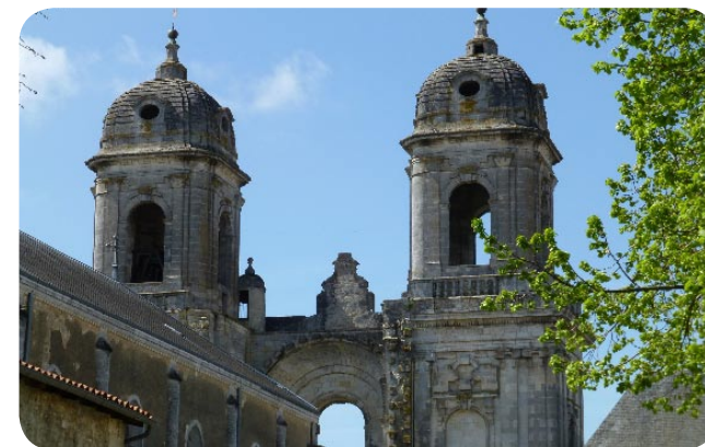
Eglise Saint-Jean-d'Angély

Outre ses sites classés remarquables (7 % de sa superficie), il compte un panel d'édifices et d'ensembles urbains exceptionnels tels les arènes de Saintes, les églises romanes de Saintonge, le vieux port de La Rochelle, l'arsenal de Rochefort, la station balnéaire de Fouras ou les villas modernes de Royan.