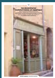
18 les devantures commerciales en applique