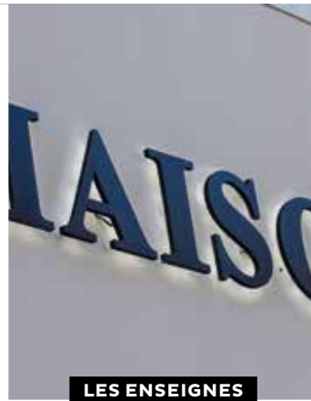
LES ENSEIGNES EN BANDEAU