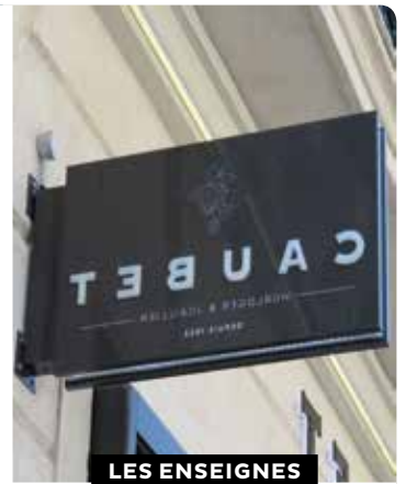
LES ENSEIGNES EN DRAPEAU