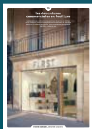
19 les devantures commerciales en feuillure

Qu'ils fassent ou non l'objet d'une protection, les centres anciens sont toujours des espaces de qualité. Chaque intervention sur les façades ou sur les toitures compte et participe à l'harmonie du paysage urbain. Au cœur de nos villes et villages, l'intérêt particulier et l'intérêt général doivent être conjugués pour créer le cadre de vie que nous y recherchons tous.