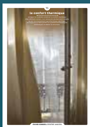
15 le confort thermique