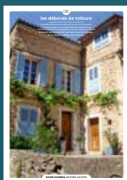
06 les débords de toiture