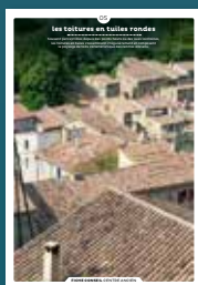
05 les toitures en tuiles rondes