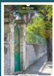
11 les clôtures

Qu'ils fassent ou non l'objet d'une protection, les centres anciens sont toujours des espaces de qualité. Chaque intervention sur les façades ou sur les toitures compte et participe à l'harmonie du paysage urbain. Au cœur de nos villes et villages, l'intérêt particulier et l'intérêt général doivent être conjugués pour créer le cadre de vie que nous y recherchons tous.