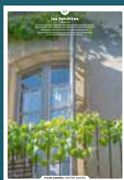
07 les fenêtres