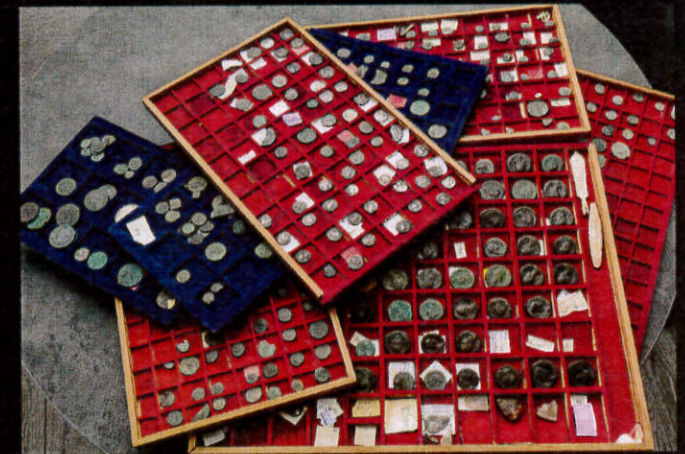
Ensemble de monnaies gauloises et romaines saisi à Grasse (Alpes-Maritimes).