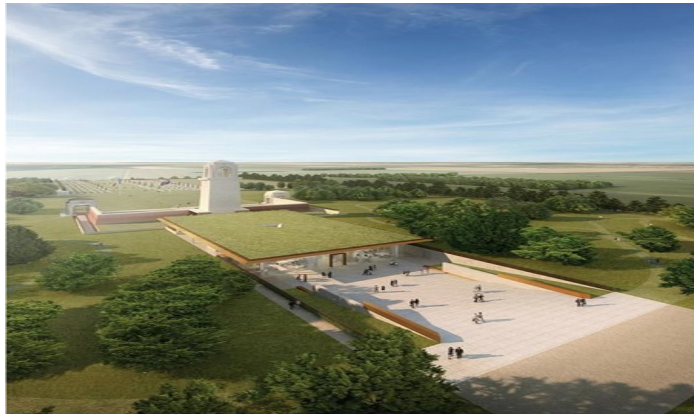
SIR JOHN MONASH CENTRE AUSTRALIAN NATIONAL MEMORIAL VILLERS-BRETONNEUX FRANCE