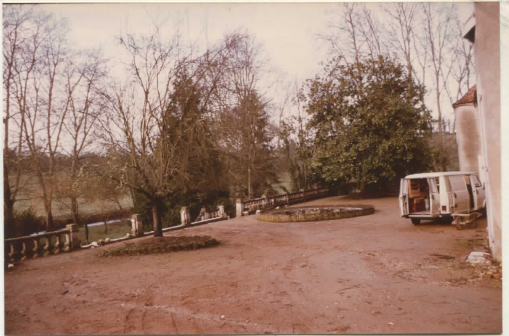
Terrasse devant la façade sud du Château juin 83 dégâts de la tempête de décembre 82 -