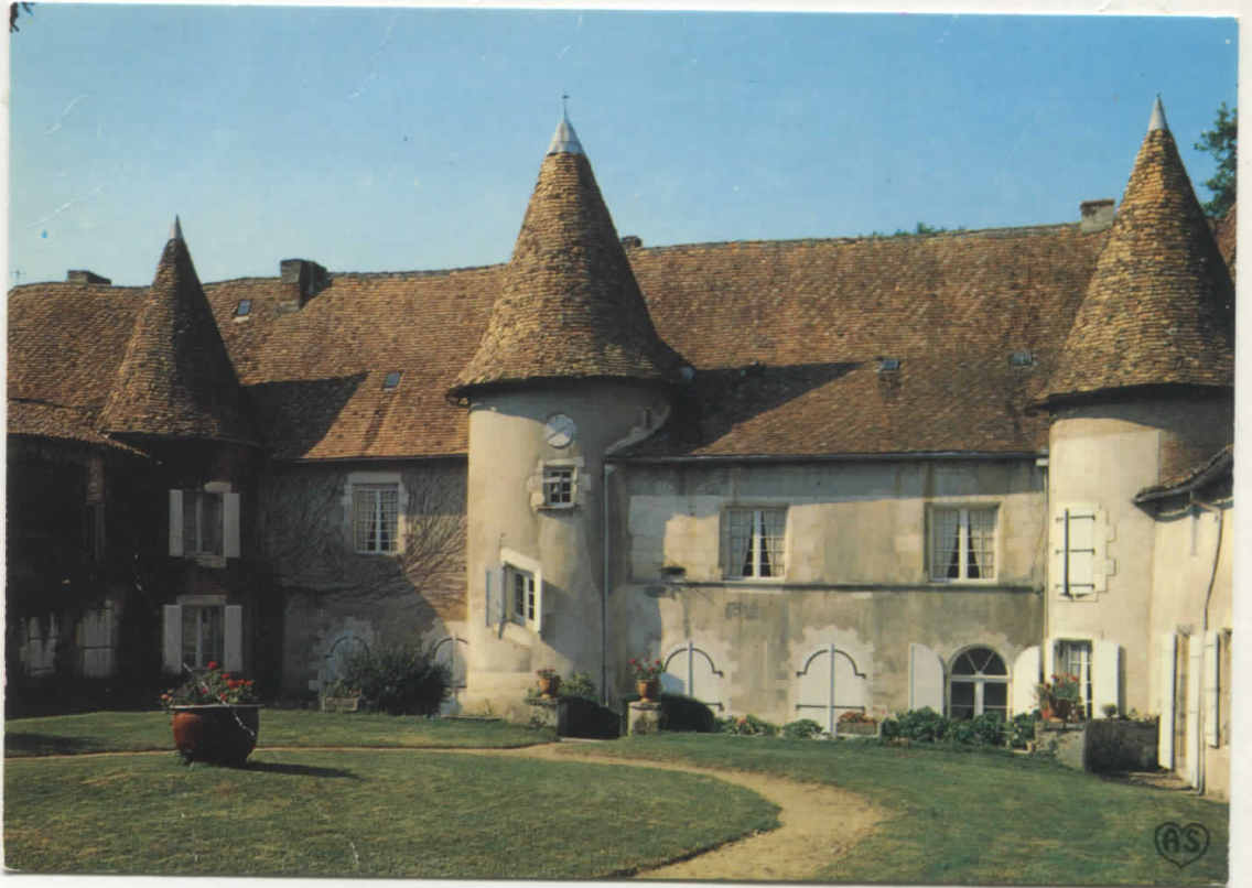
facade nord sur cour d'honneur carte postale