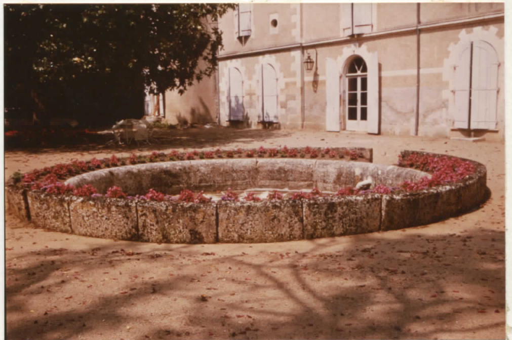
le long de la façade sud terrasse et fouloir à pommes