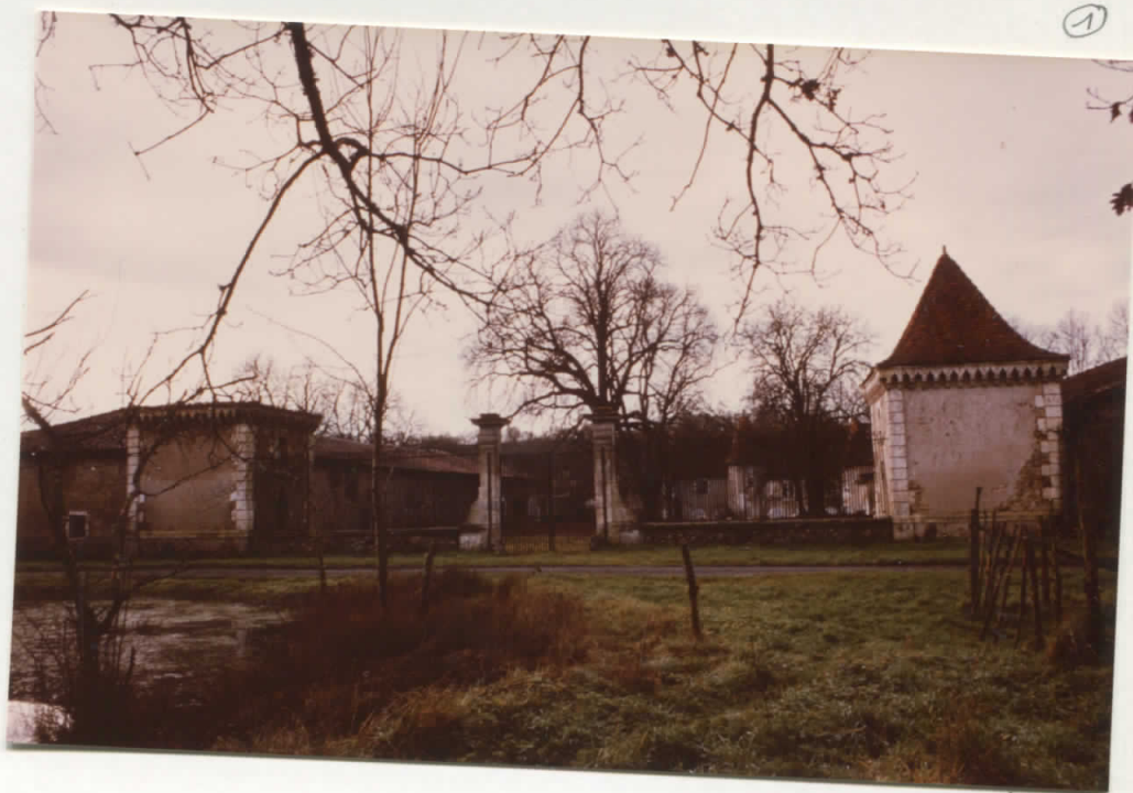
Grille encadrée de 2 pavillons de garde fermant la cour d'honneur au nord - Au fond, le château