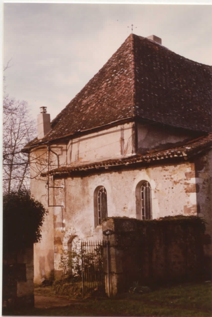
Facade est du château: chapelle.