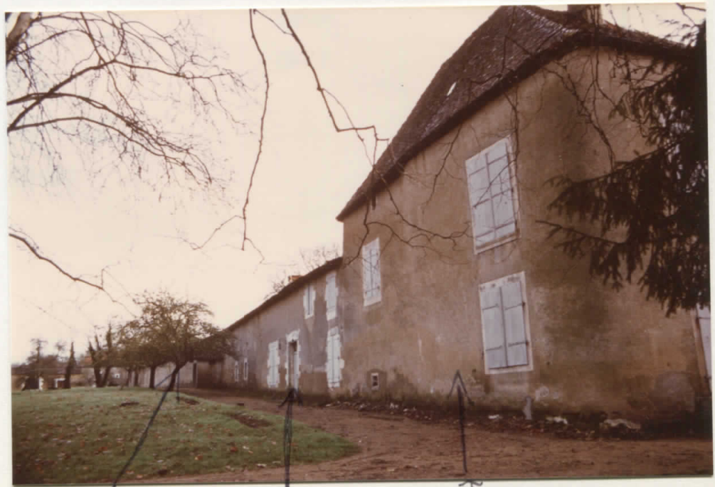
Façade Ouest du Château et des Communs