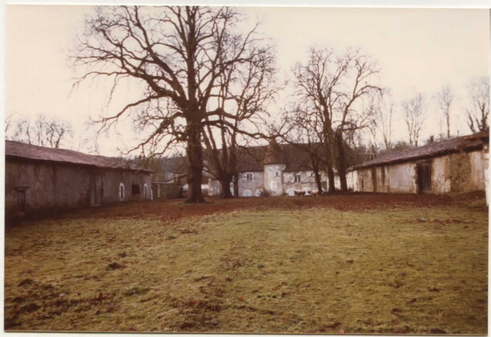
Au premier plan Cour d'honneur ; au fond, château - De chaque côté la cour est fermée de communs -