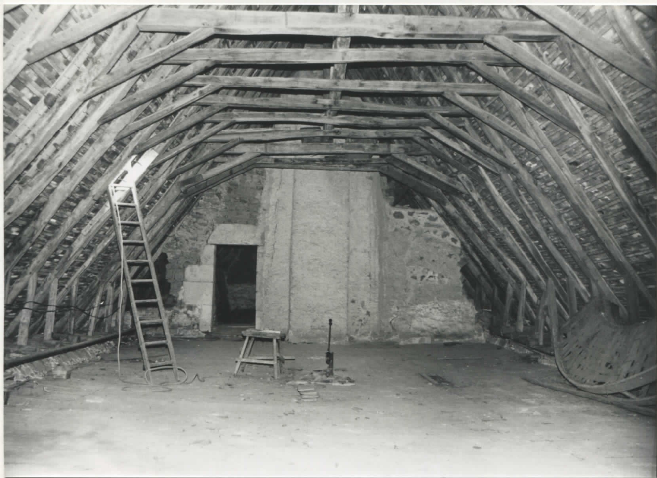
Charpente à chevrons portant fermes du corps de logis ; vue vers l'est -