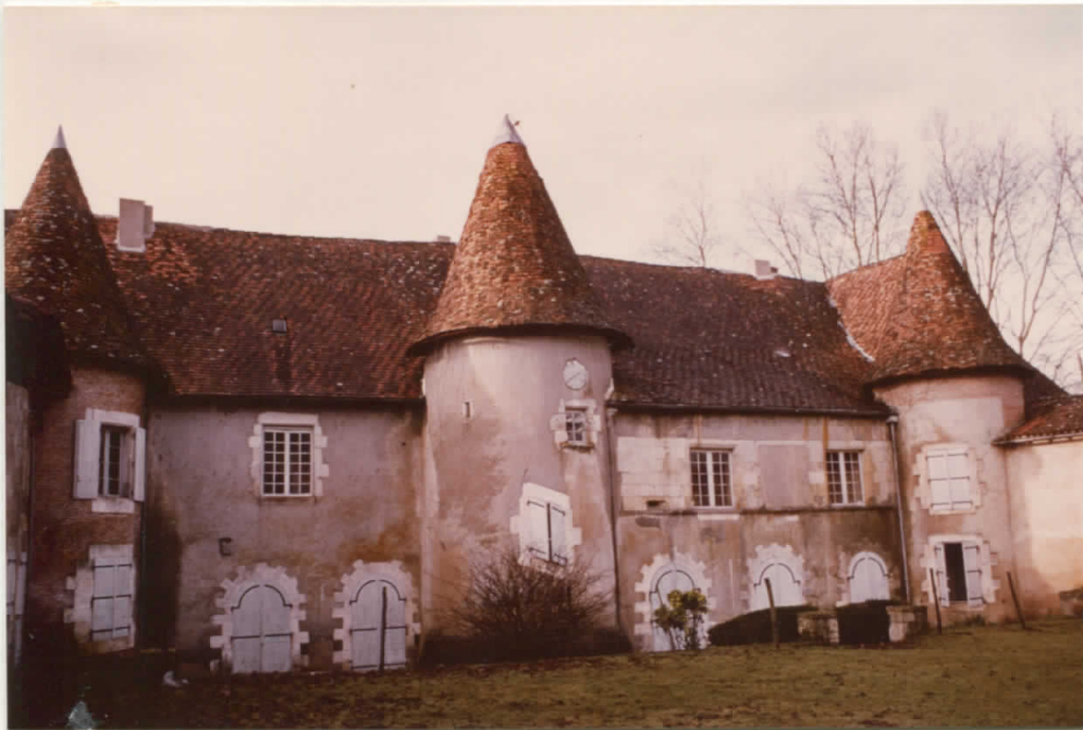
Tourelles latérales remon- -trées(?) en brique La partie droite du corps de logis et la tour elle centrale sont les parties les plus anciennes Reperçement du rez de chaussée sous la restaura- -tion