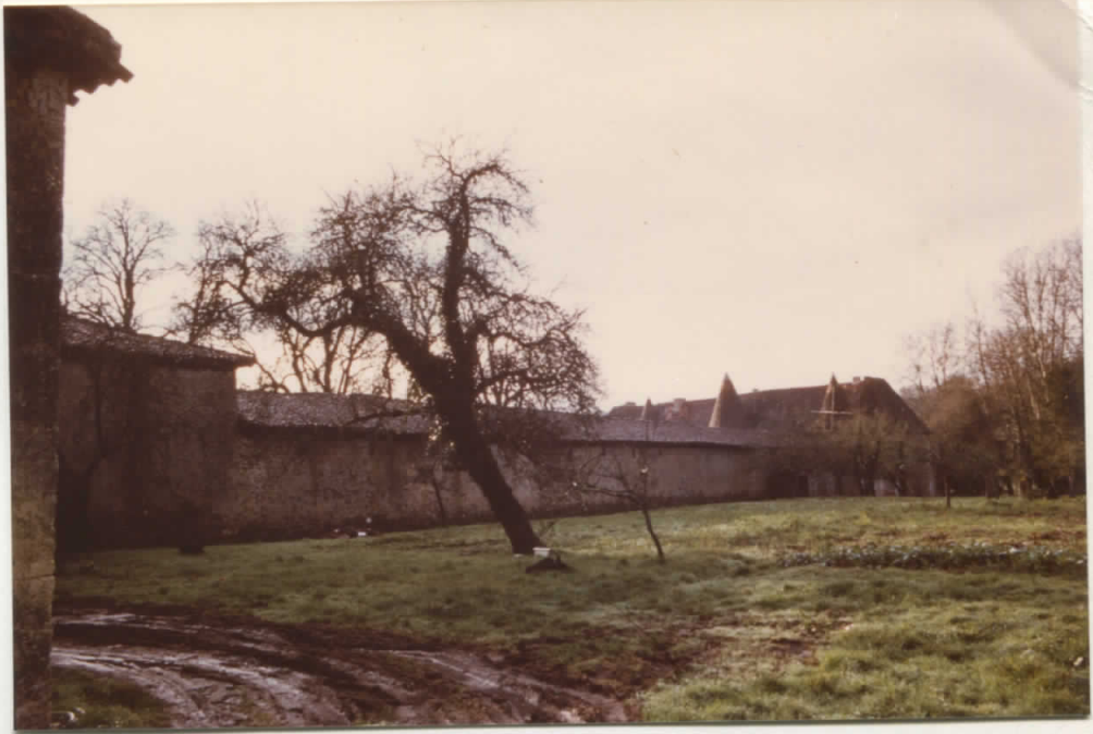
Revers de l'aile Ouest des Communs