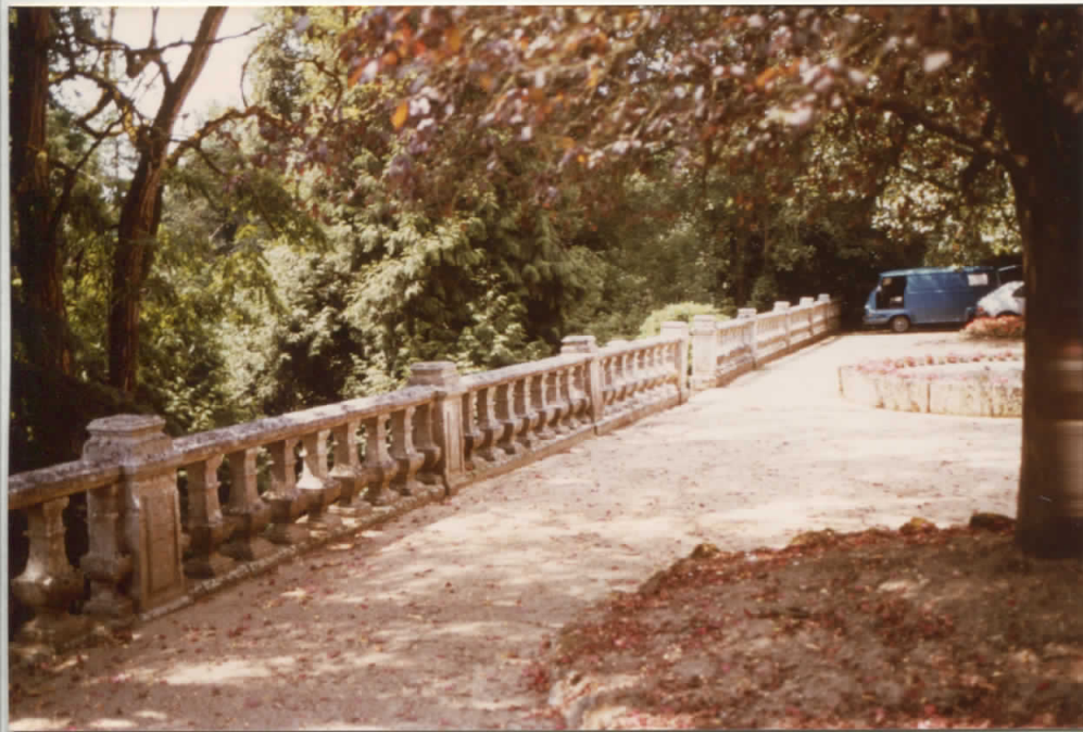
balustrade de la terrasse en été avant que la tempête de décembre ne fasse tomber l'arbre au premier plan sur elle.