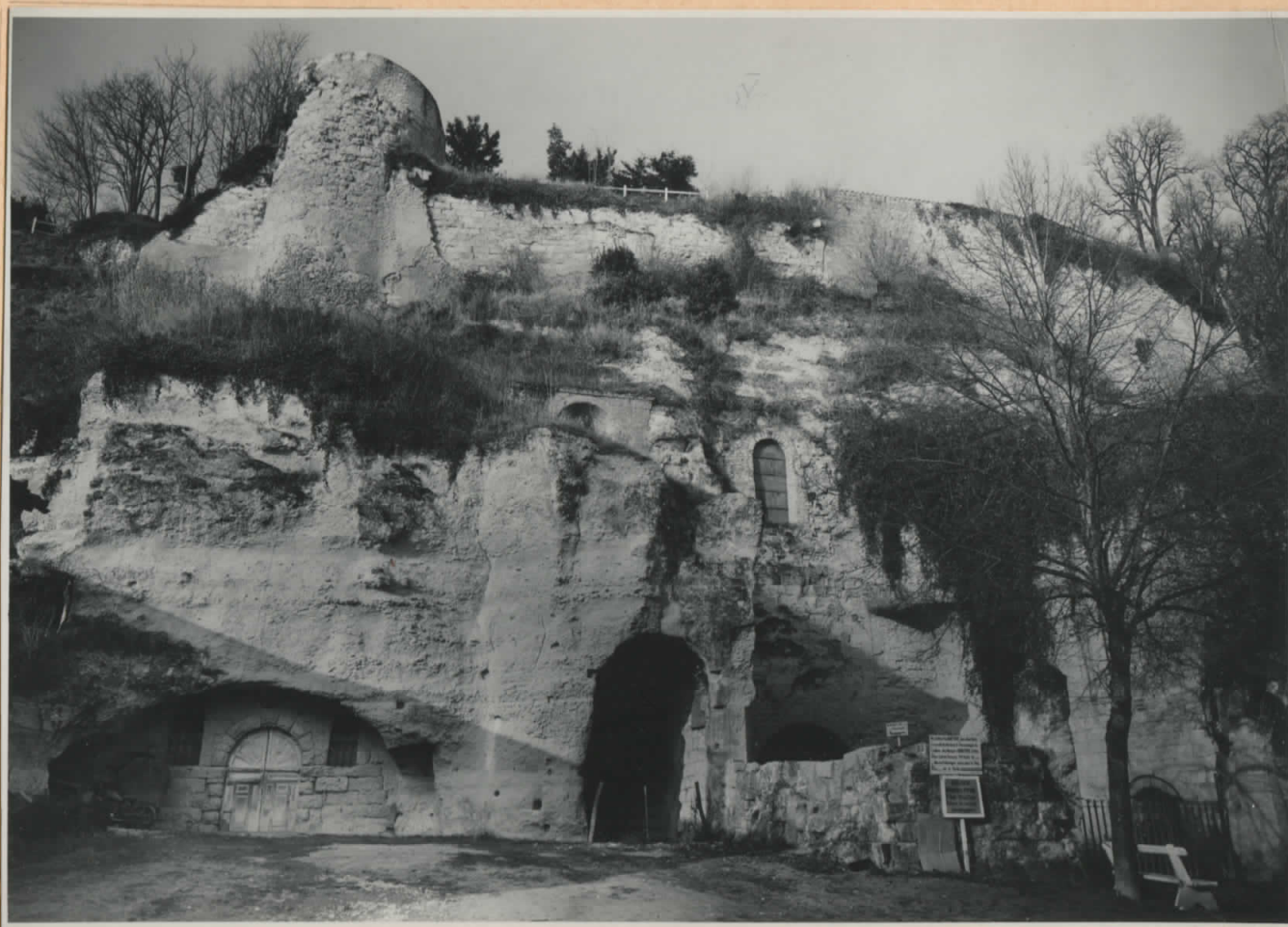
Tour St-Jean et enceinte Est dominant l'entrée de l'Eglise souterraine — de l'Est