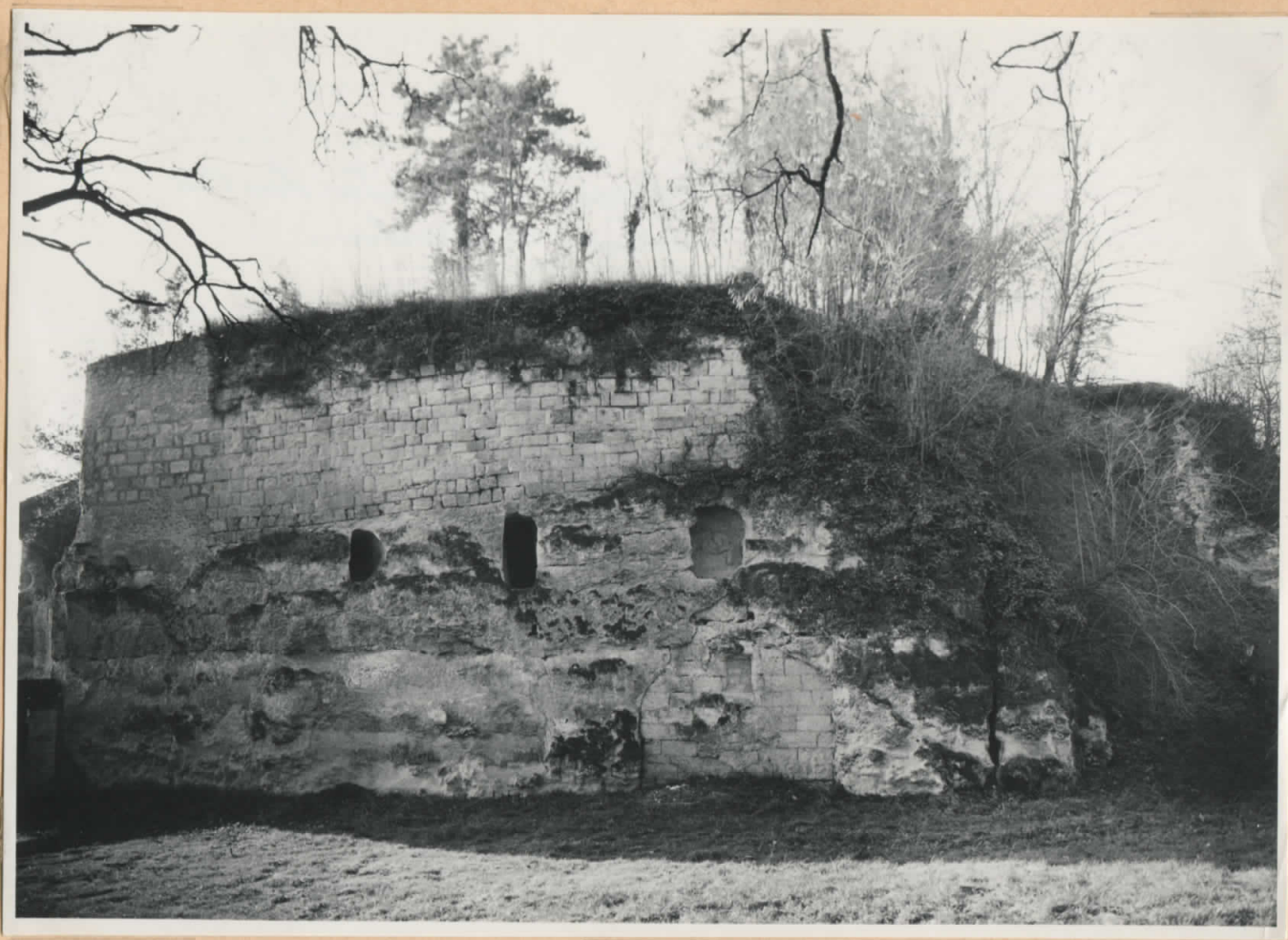
Pris de l'Est, le chemin de ronde taillé dans la roche