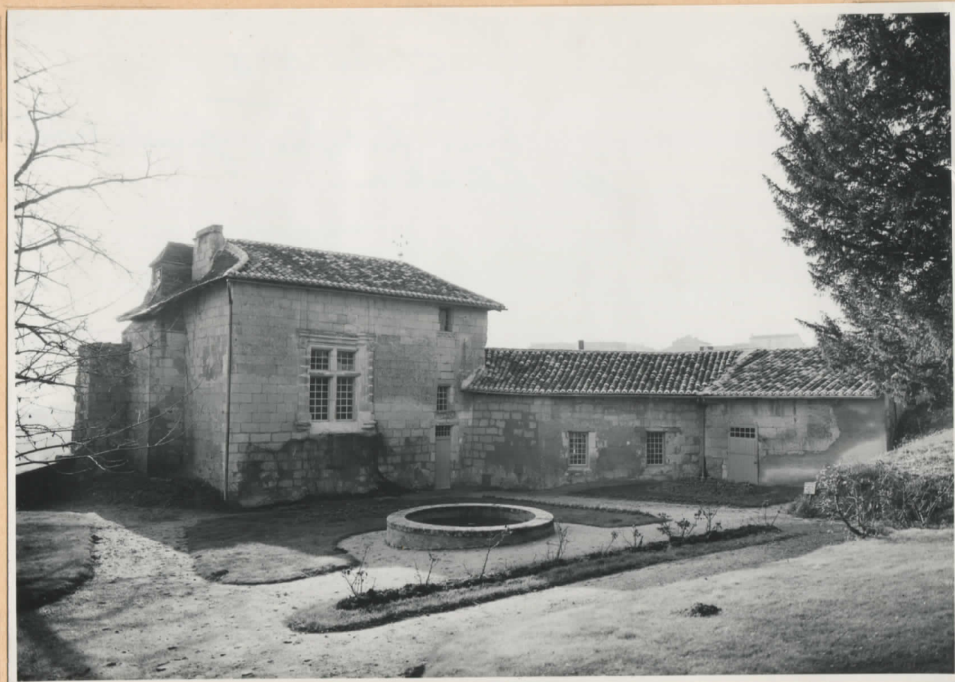
Façade Nord Le haut de la tour fortifiée avec sa fenêtre Renaissance et le petit logis qui lui est contigu