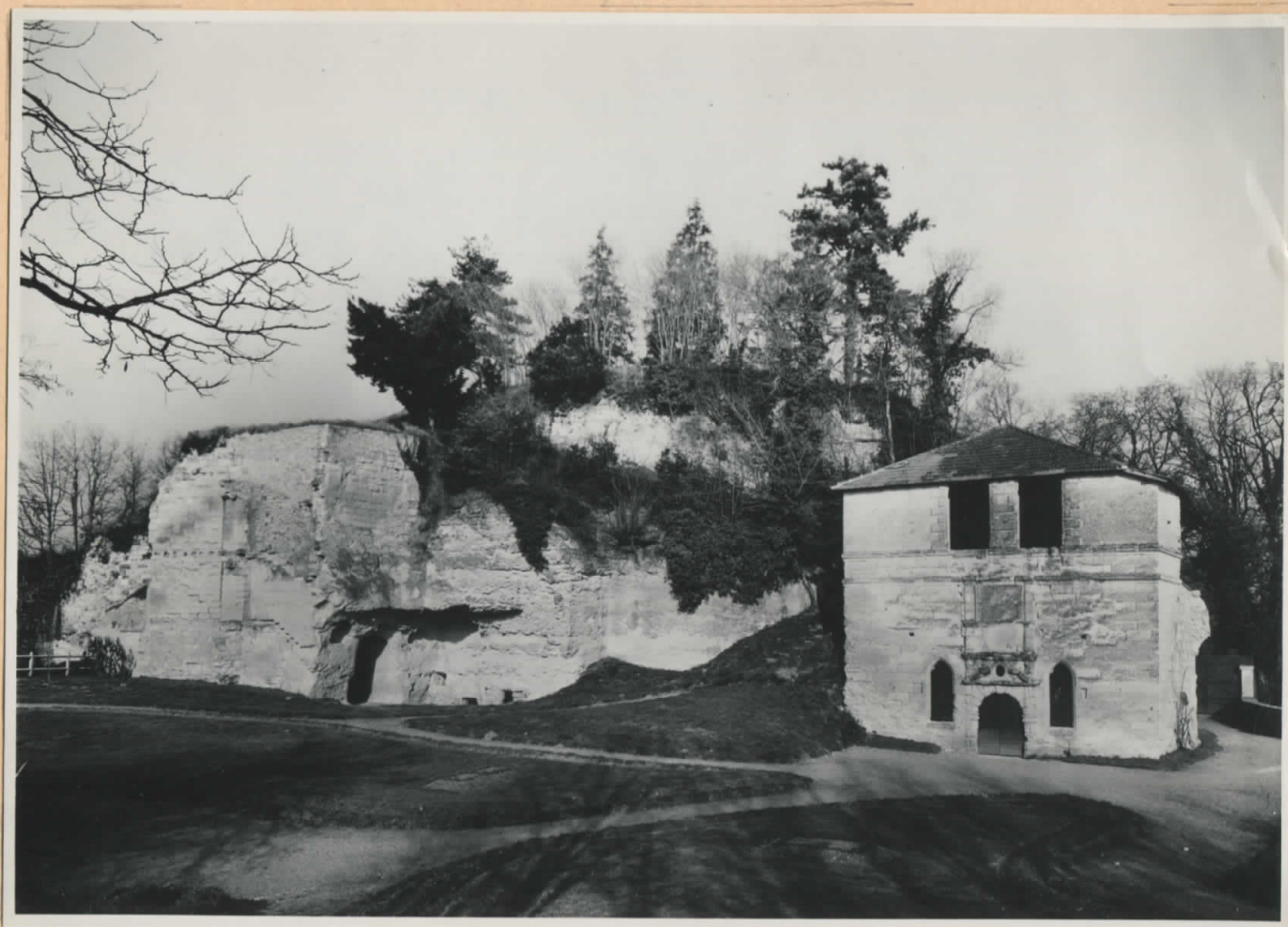
Façade de la chapelle vue du midi (Logis du chapelain au dessus) et ruines du château du XI e siècle