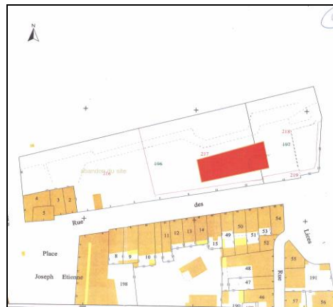
Emprise de la protection sur fond cadastral

Le site de la carrière antique de la Corderie est inscrit par arrêté du 24 janvier 2018.