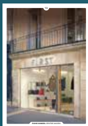
19 les devantures commerciales en feuillure