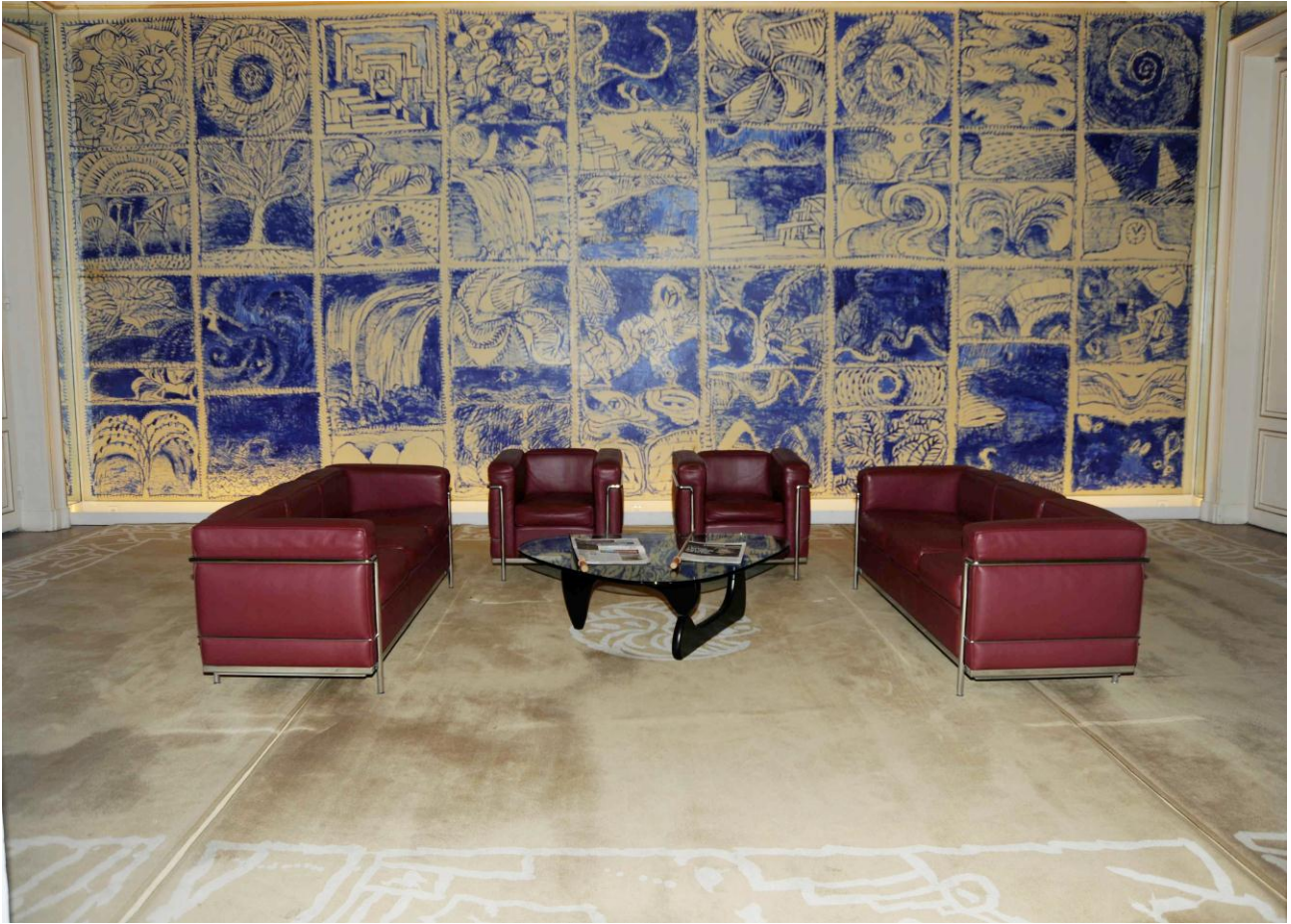
Savonnerie en 3 parties pour le salon du Ministère de la Culture et de la Communication, d'après Alechinsky