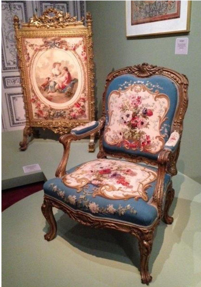
Fauteuil de style Louis XV pour le salon de l'Hémicycle de l'Elysée, d'après Chabal-Dussurgey, Mobilier national