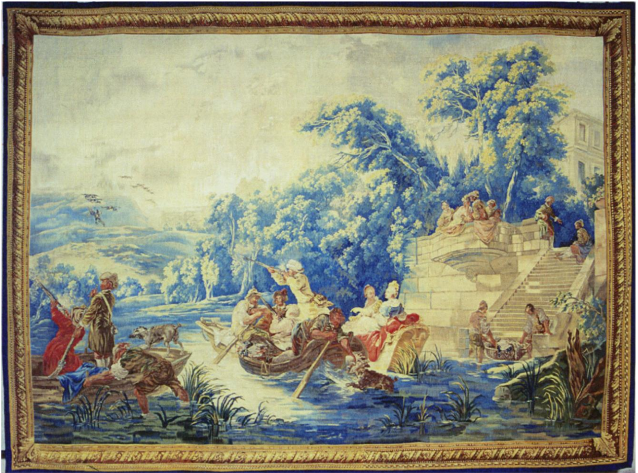
Tenture des amusements de la campagne : la Chasse aux canards, d'après Casanova, Mobilier national