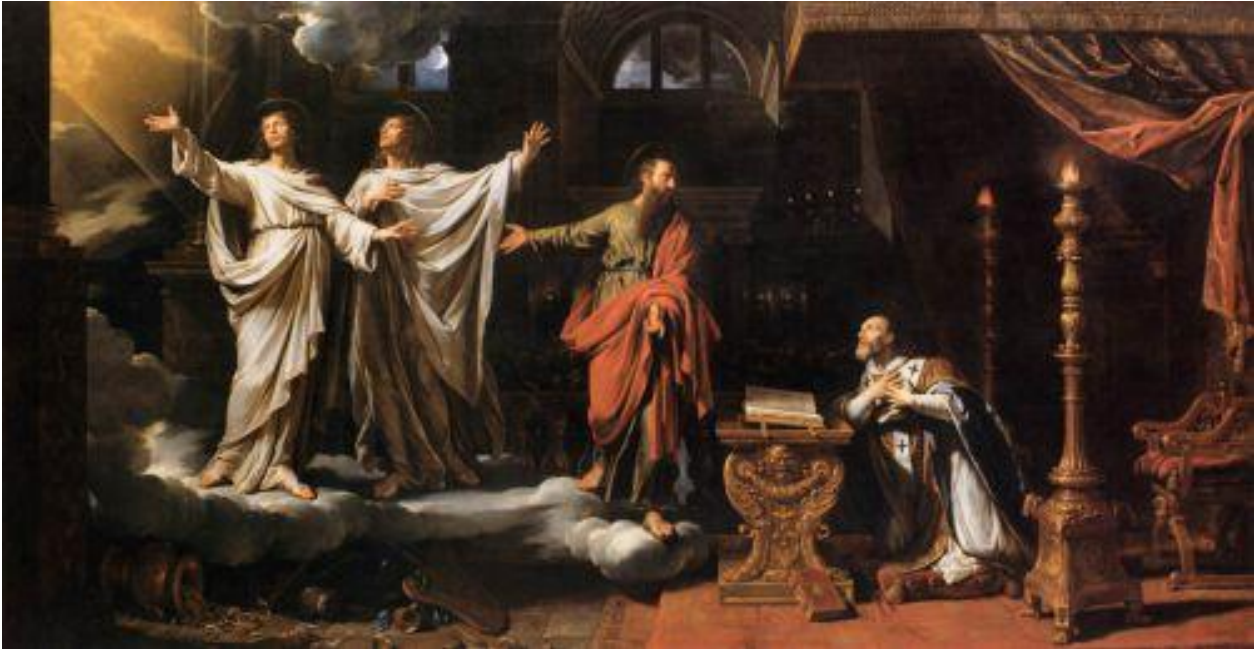
Carton de tapisserie pour la tenture de saint Gervais et saint Protais : Apparition de saint Gervais et saint Protais à saint Ambroise, par Philippe de Champaigne, musée du Louvre