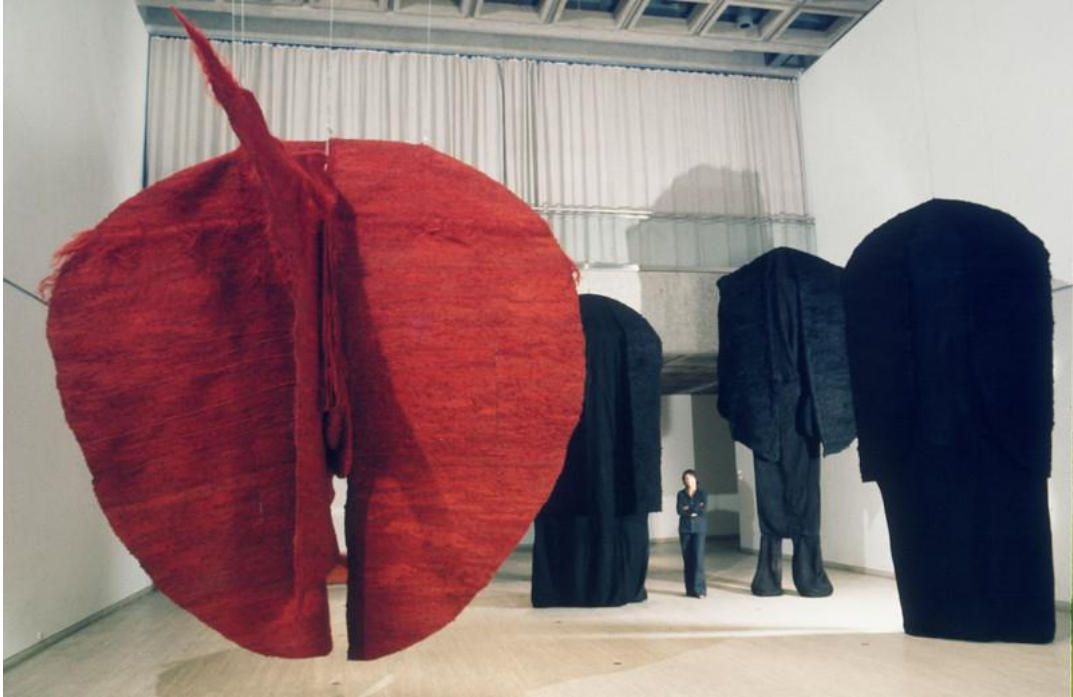
Pièce textile Abakan, d'après Abakanovitch