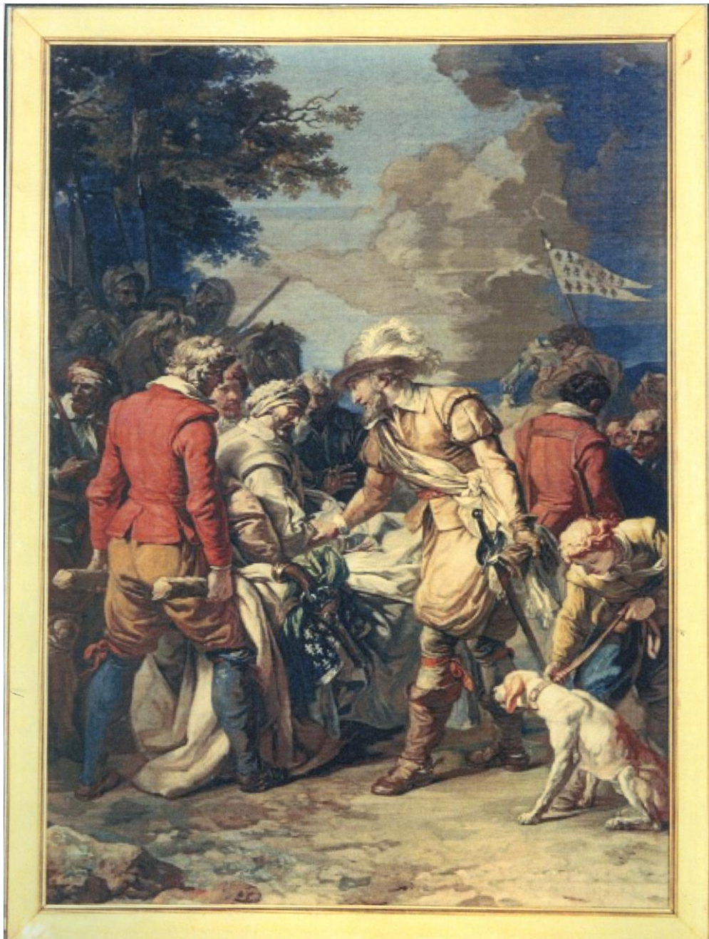
Histoire d'Henri IV : Henri IV rencontre Sully blessé, d'après Vincent, Mobilier national