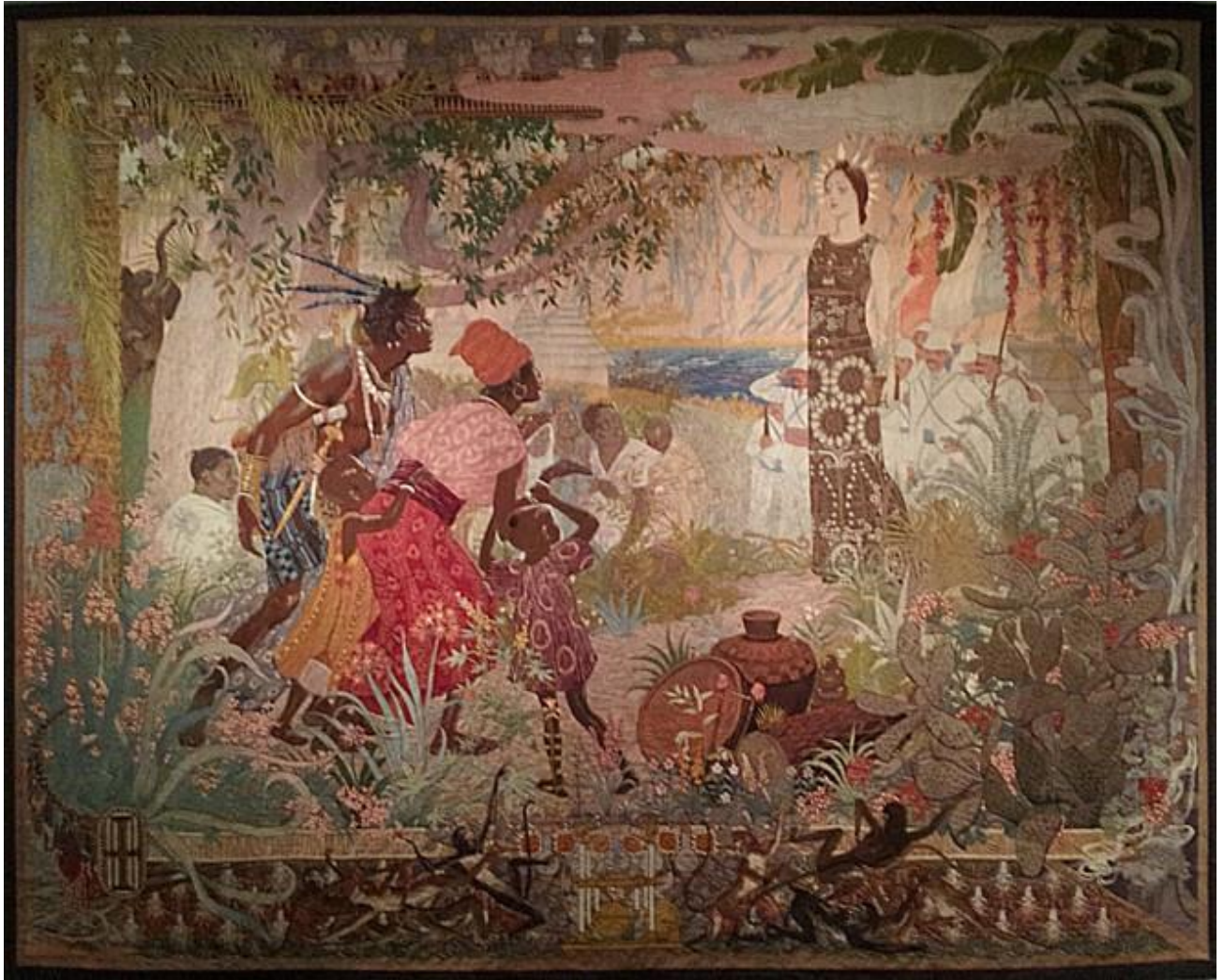
La Conquête de l'Afrique, d'après Rochegrosse, Mobilier national