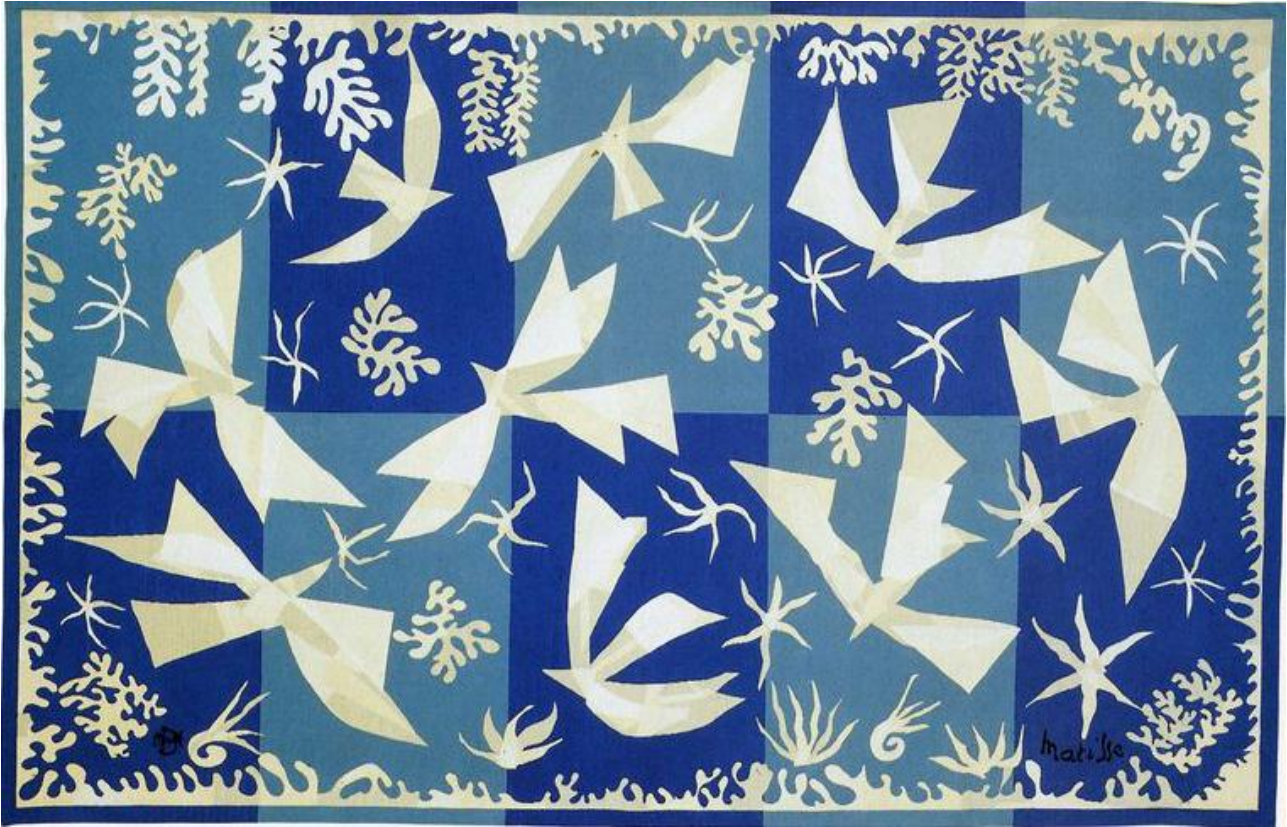
La Polynésie : le Ciel, d'après Matisse, Mobilier national