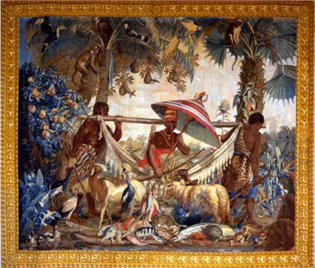
Les Nouvelles Indes, d'après Desportes, Mobilier national