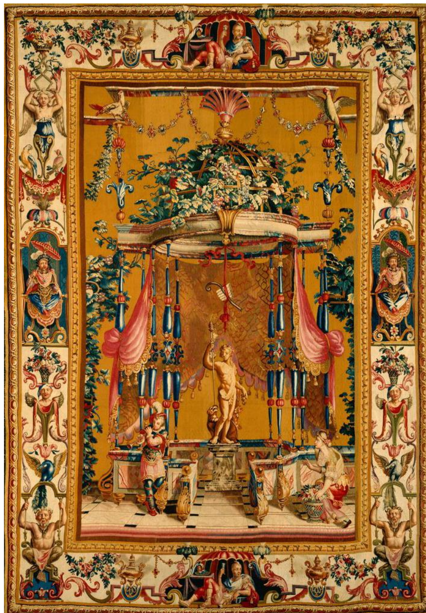
Tenture des Grottesques : Offrande à Bacchus, d'après Monnoyer, Mobilier national