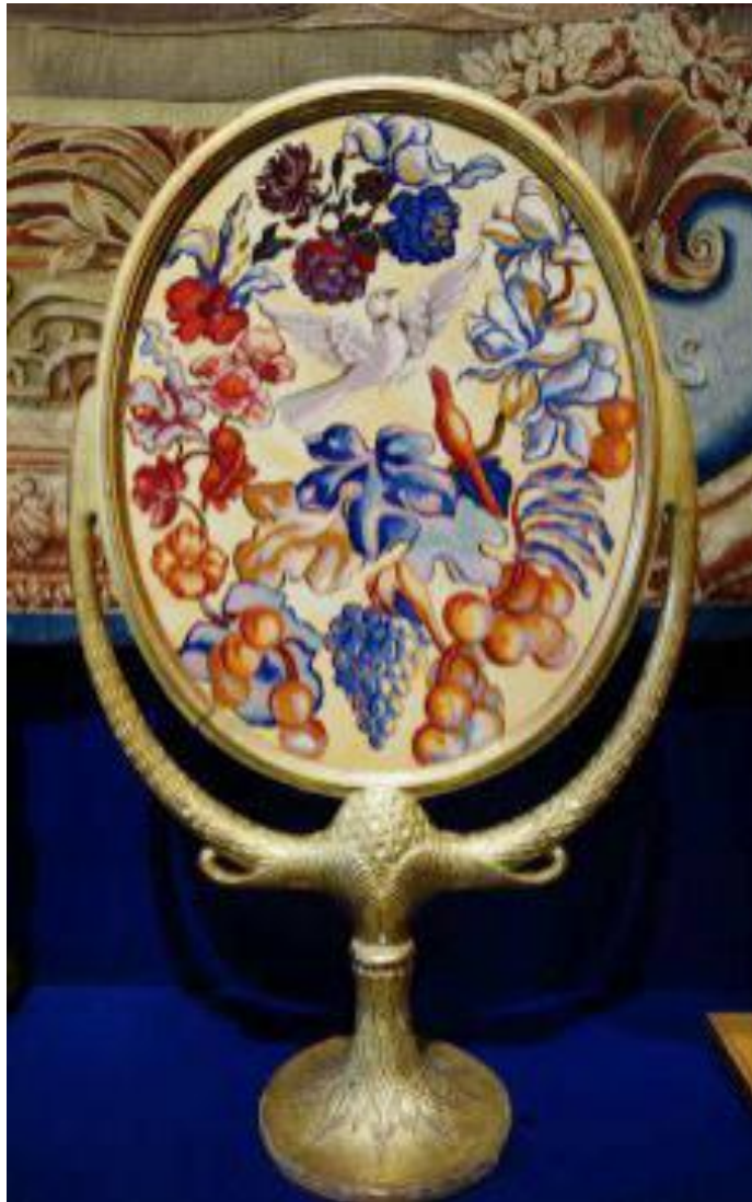
Les Oiseaux d'or, d'après Piot, Mobilier national