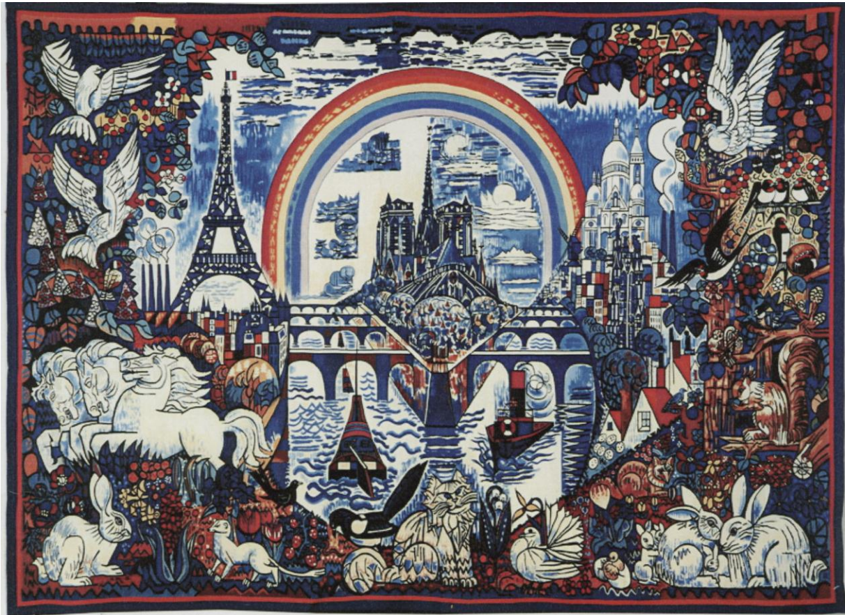
Tenture des Saisons : Paris, d'après Gromaire, Mobilier national