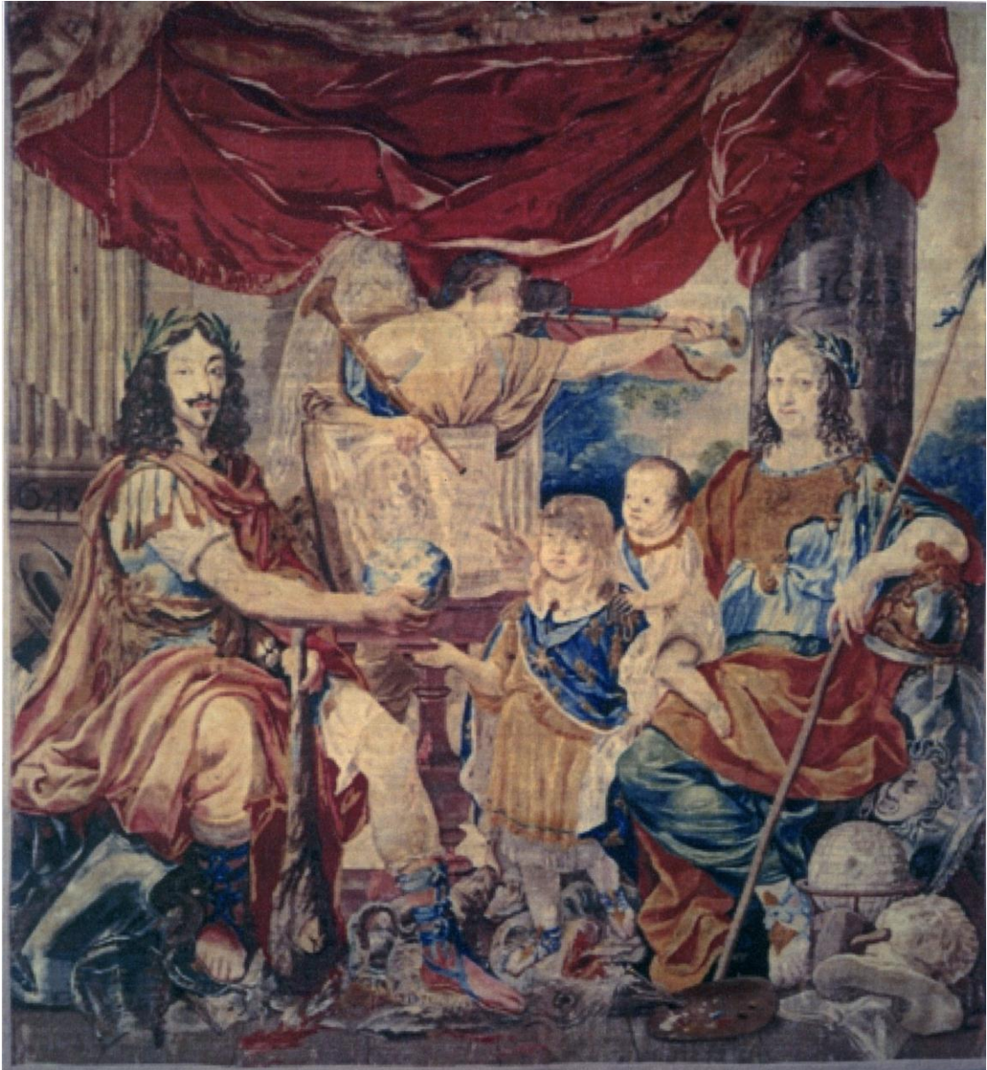
Louis XIII et sa famille, d'après Vouet, Mobilier national