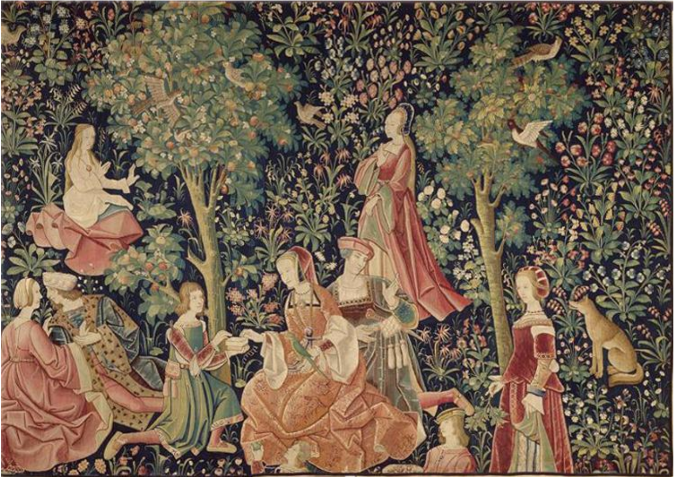
Tenture de La Vie seigneuriale, musée de Cluny