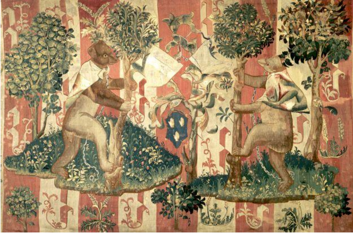
Tapiserie, les Ours porteurs d'écus armoriés, musée du Louvre