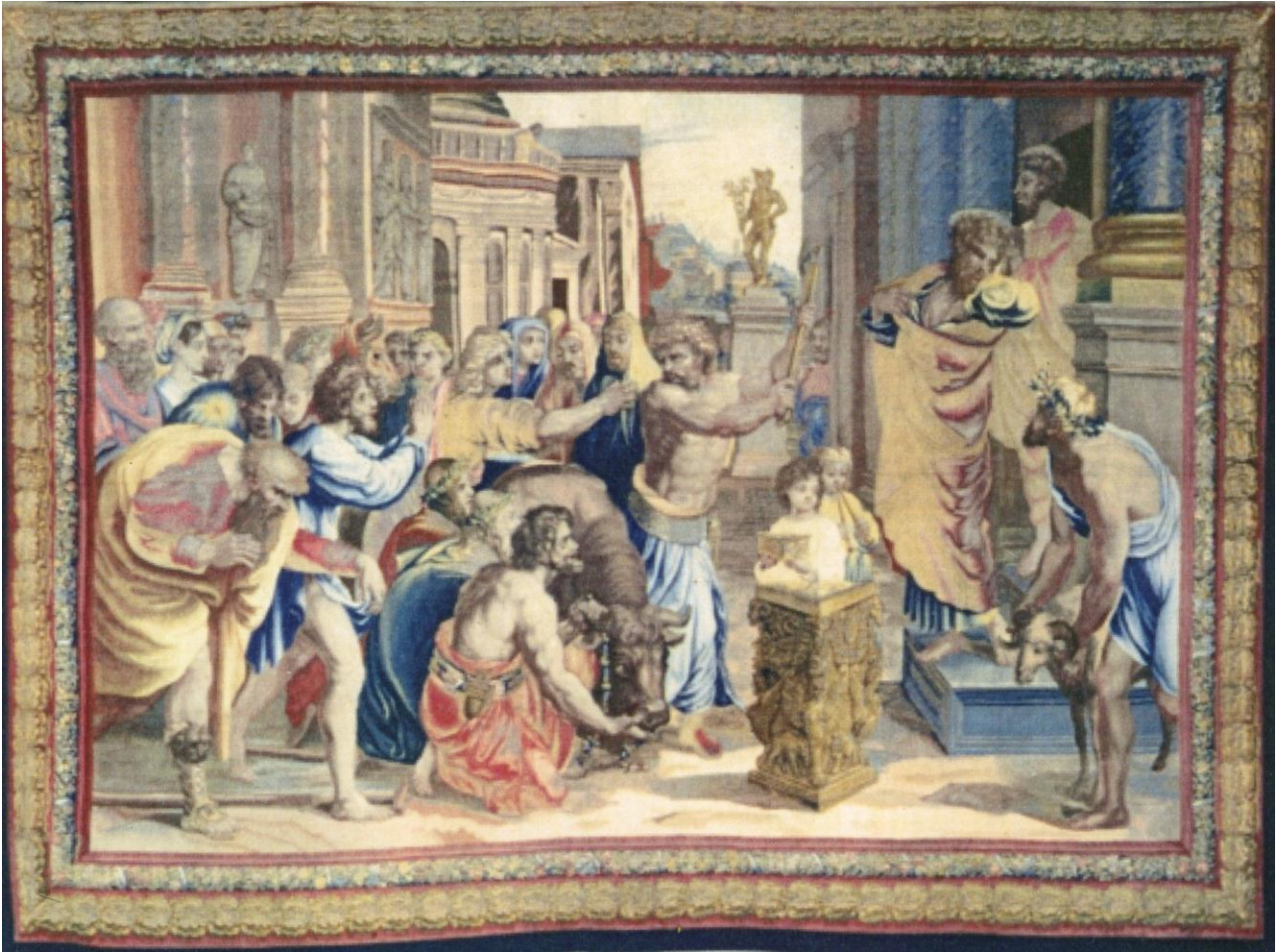
Les Actes des Apôtres : le Bon pasteur, d'après les modèles de Raphaël