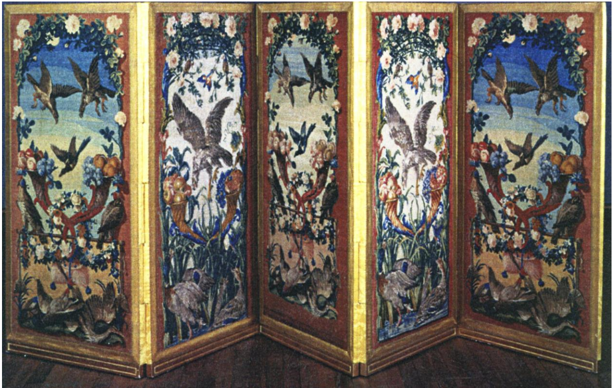
Paravent à 5 feuilles couvert en savonnerie, d'après Desportes, Mobilier national