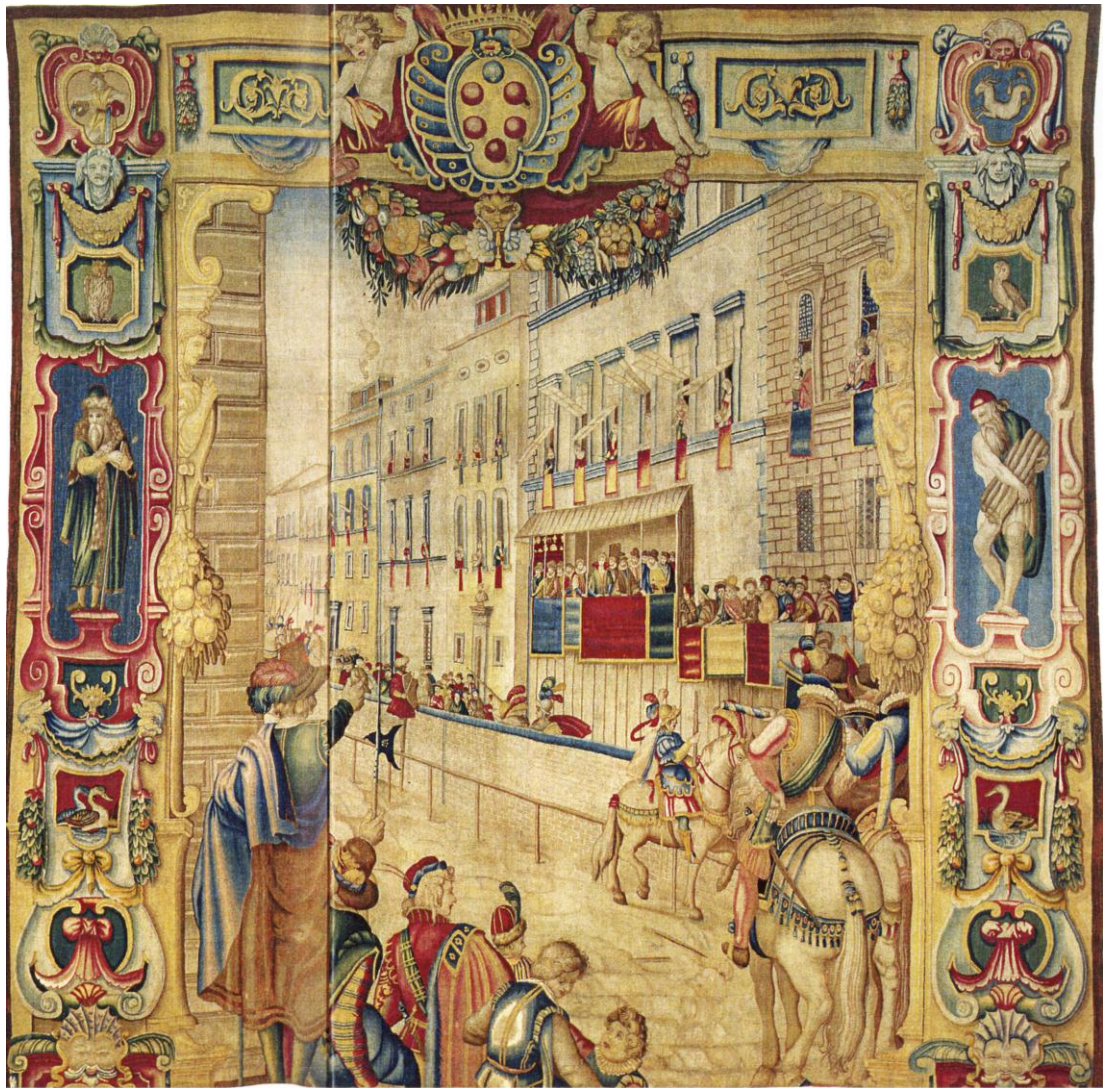
La Giostra del Saracino in via larga, d'après Cinganelli