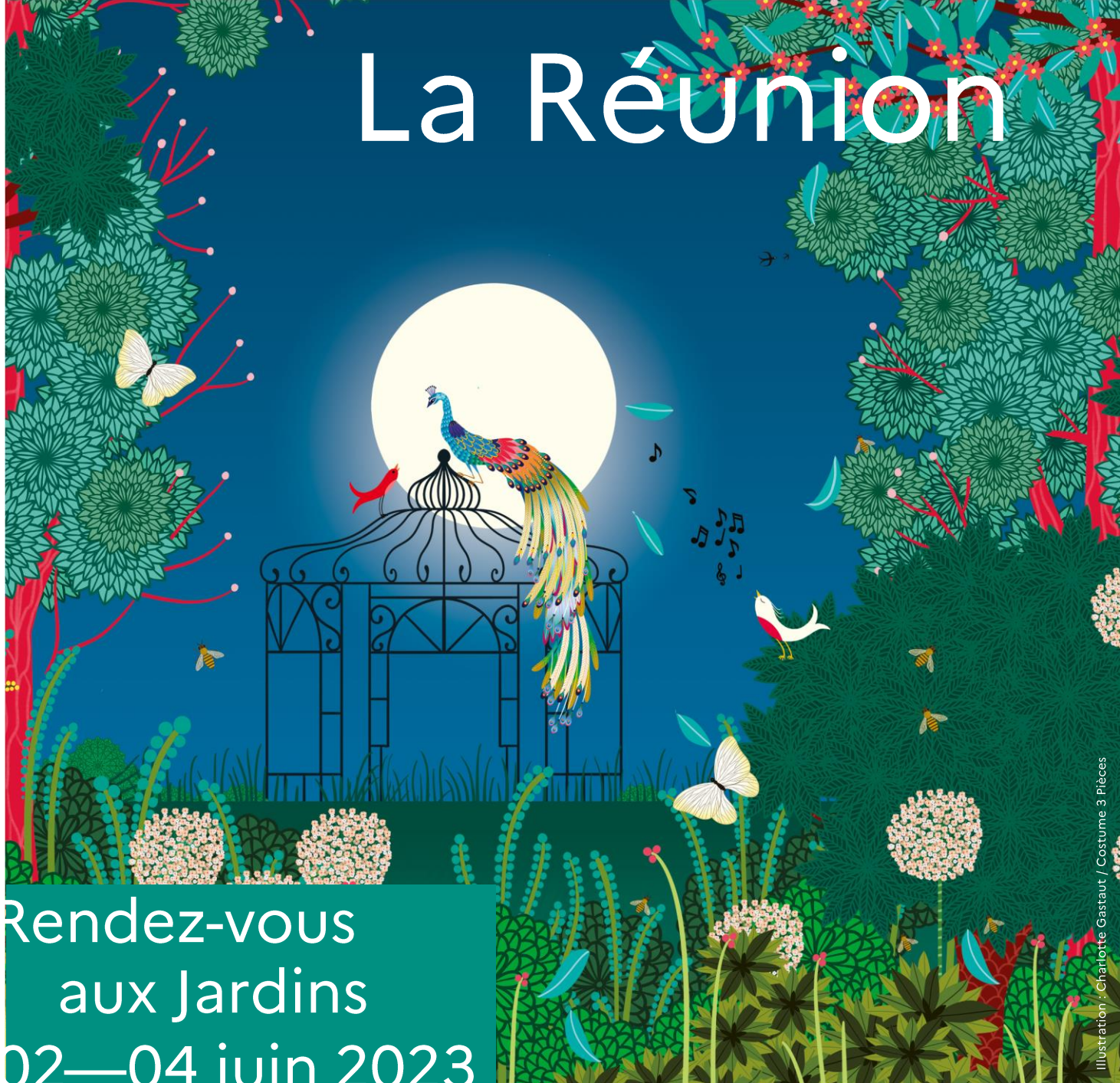
Illustration : Charlotte Gastaut / Costume 3 Pièces