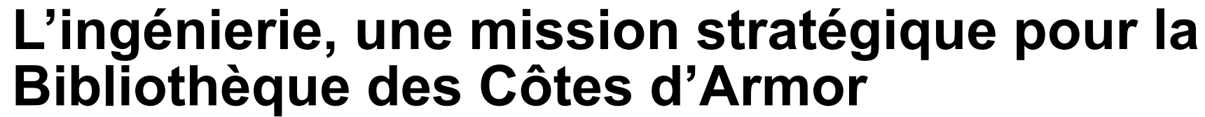
SCHÉMA DÉPARTEMENTAL DE DÉVELOPPEMENT DE LA LECTURE PUBLIQUE 2022/2027